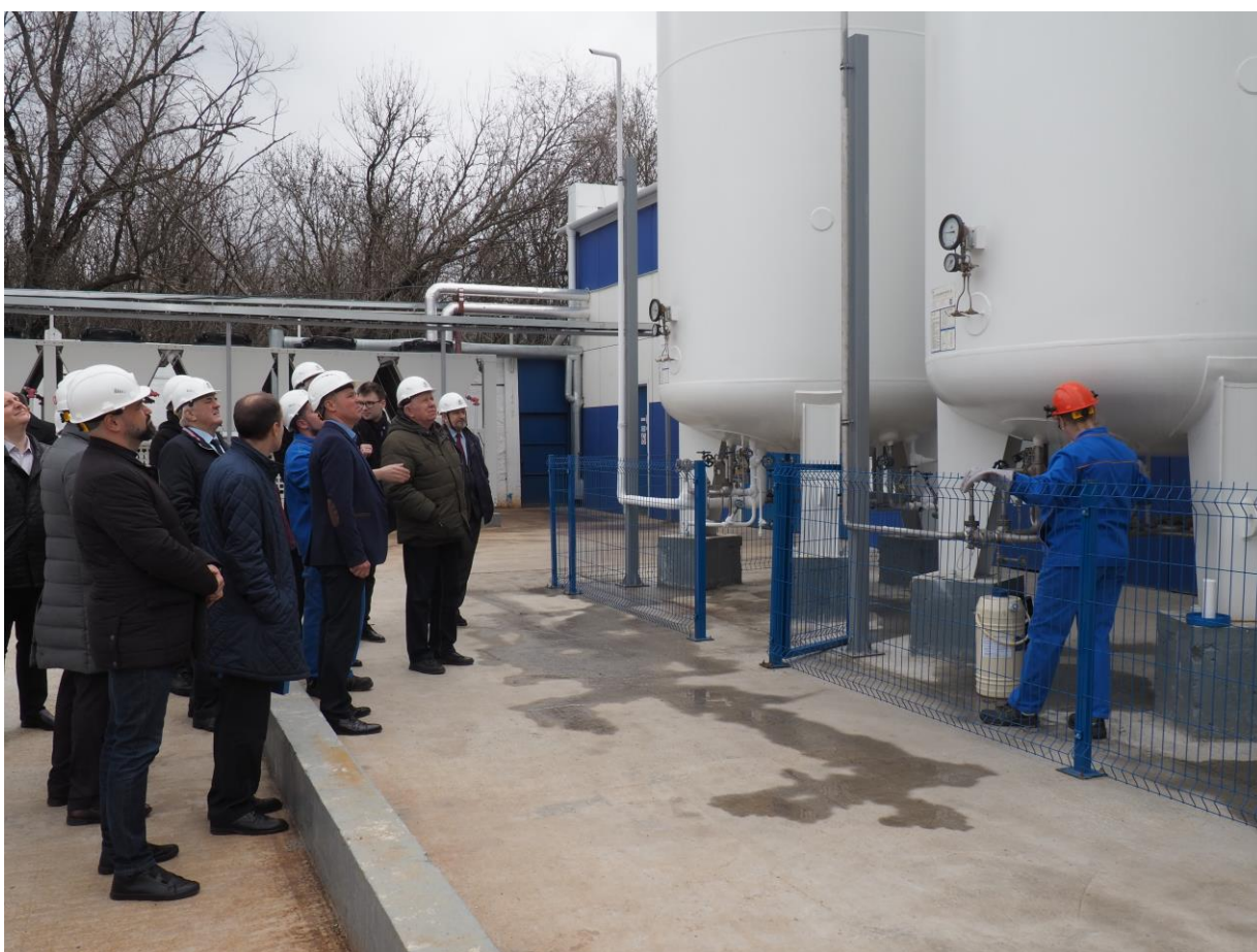
Выездное совещание комитета 24 марта 2023 года