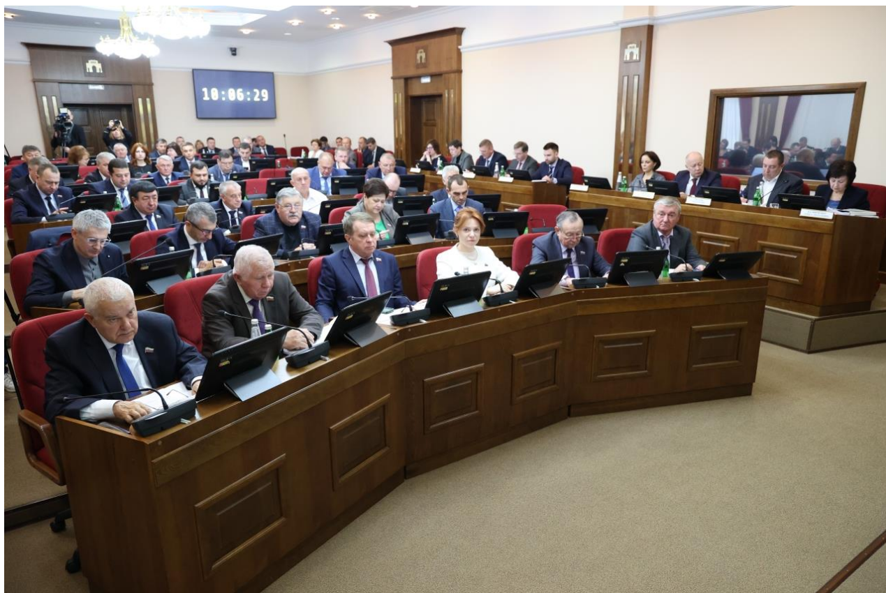
Заседание Думы Ставропольского края

Закон разработан в связи с изменениями части 1 статьи 53 Федерального закона от 21 декабря 2021 года № 414-ФЗ "Об общих принципах организации публичной власти в субъектах Российской Федерации" (далее – Федеральный закон), внесенными Федеральным законом от 19 декабря 2022 года № 519-ФЗ "О внесении изменений в отдельные законодательные акты Российской Федерации и приостановлении действия отдельных положений законодательных актов Российской Федерации".