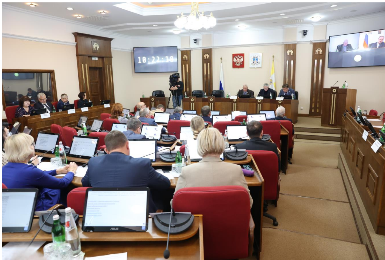
Совещание в комитете 28 ноября 2023 года

О проекте закона Ставропольского края № 298-7 "О внесении изменений в Закон Ставропольского края "Об установлении срока рассрочки оплаты приобретаемого имущества при реализации преимущественного права субъектов малого и среднего предпринимательства на приобретение арендуемого имущества в отношении недвижимого имущества, находящегося в государственной собственности Ставропольского края";