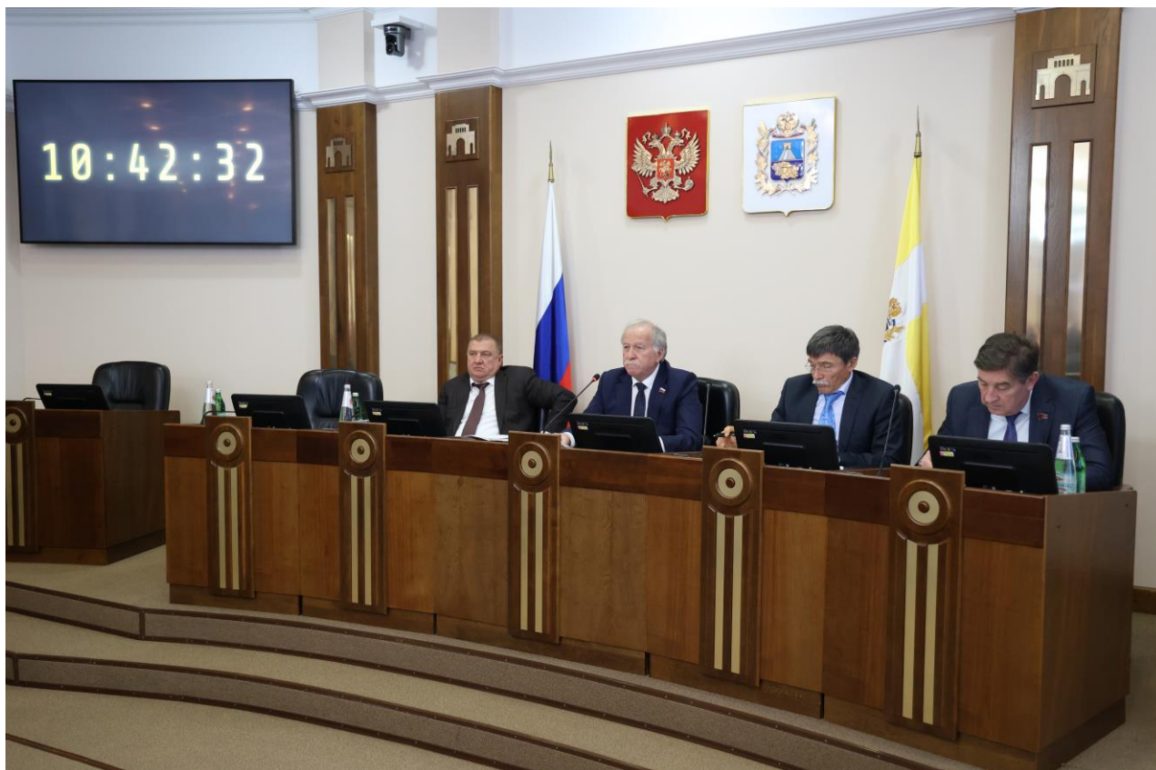
Заседание Думы Ставропольского края

В связи с этим Закон вносит изменения в Закон Ставропольского края от 06.11.97 № 32-кз "О Правительстве Ставропольского края", в Закон Ставропольского края от 06.01.99 № 2-кз "О Губернаторе Ставропольского края" и Закон Ставропольского края от 10 апреля 2017 г. № 31-кз "О стратегическом планировании в Ставропольском крае", предусматривающие исключение представления Губернатором Ставропольского края в Думу Ставропольского края ежегодного отчета о ходе исполнения плана мероприятий по реализации стратегии социально-экономического развития Ставропольского края.