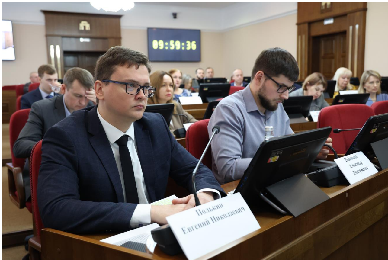
Совещание в комитете 2 февраля 2023 года

2 февраля 2023 года рассмотрен вопрос "Об исполнении Закона Ставропольского края от 12 мая 2012 г. № 48-кз "О некоторых вопросах розничной продажи алкогольной продукции и безалкогольных тонизирующих напитков на территории Ставропольского края, внесении изменений в Закон Ставропольского края "Об административных правонарушениях в Ставропольском крае" и признании утратившими силу отдельных законодательных актов Ставропольского края" (в части дополнительного ограничения времени, условий и мест розничной продажи алкогольной продукции).