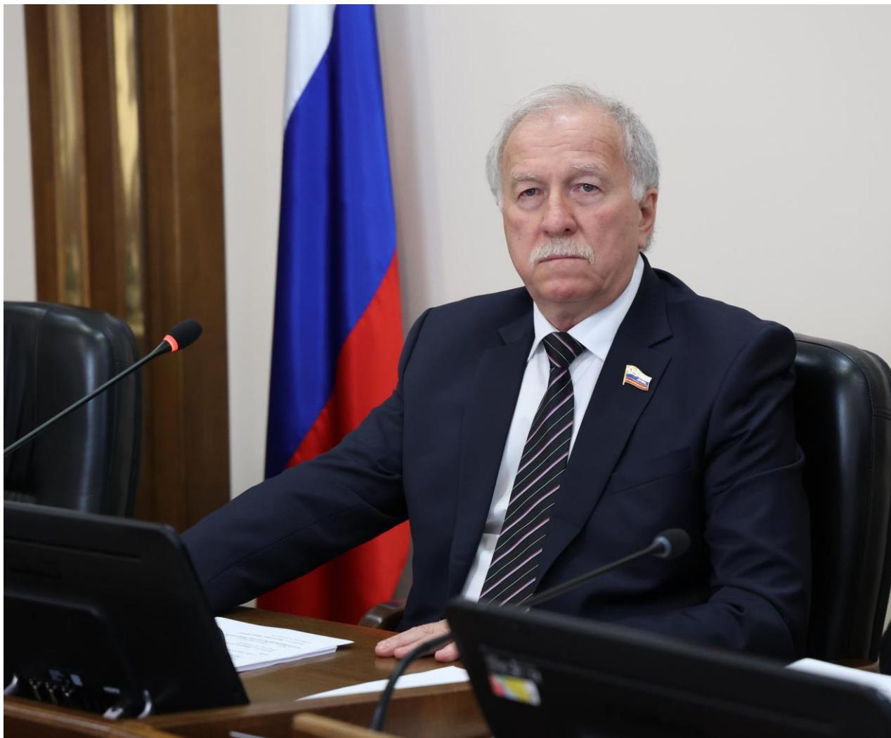
Н.Т. Великдань, председатель Думы Ставропольского края