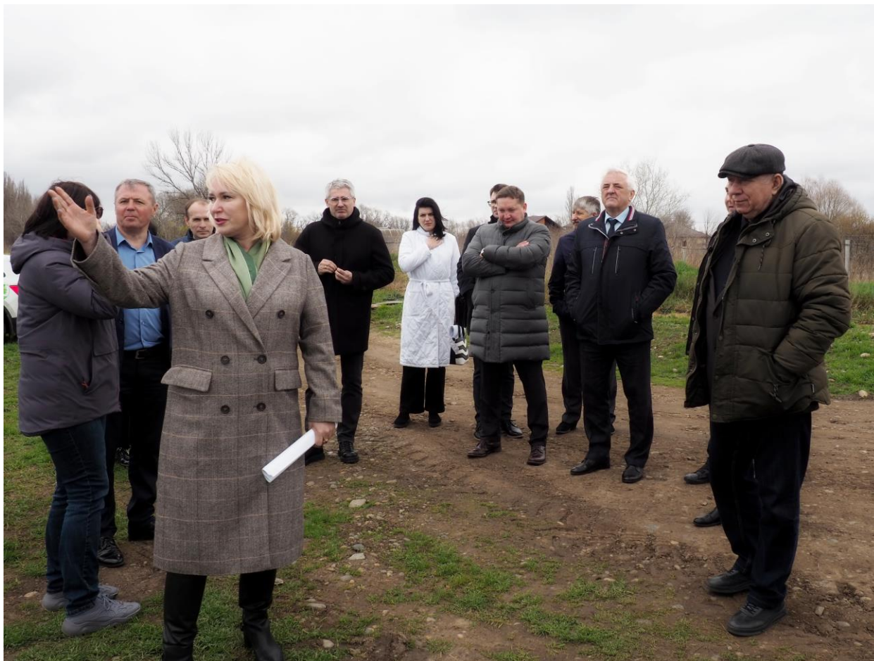
Выездное совещание комитета 24 марта 2023 года