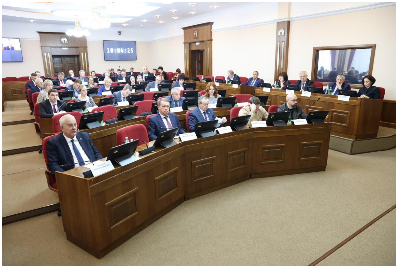
Совещание в комитете 28 ноября 2023 года

12 октября 2023 года рассмотрены вопросы: