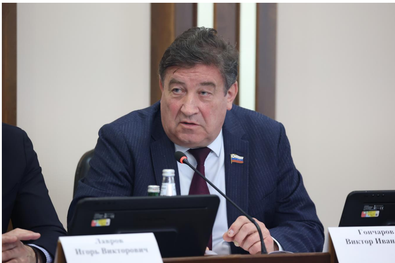
В.И. Гончаров, первый заместитель председателя Думы Ставропольского края

За отчетный период подготовлено и проведено 9 заседаний комитета в очной форме, на которых рассмотрен 41 вопрос, и 13 заседаний комитета, на которых принято 28 решений путем опроса членов комитета.