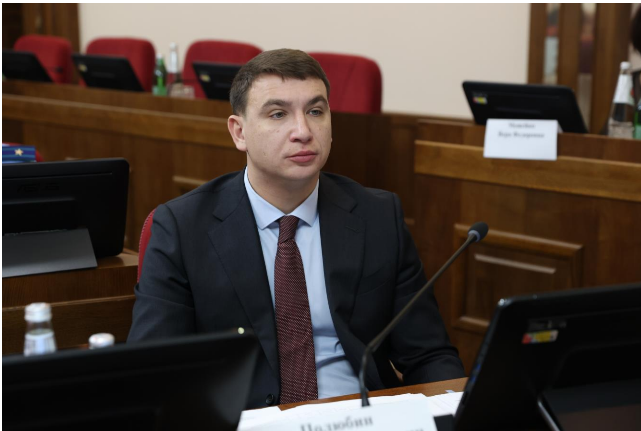
Д.В. Полюбин, министр экономического развития Ставропольского края

О согласовании присвоения почетного звания "Город военно-исторического наследия" городу-курорту Ессентуки Ставропольского края.