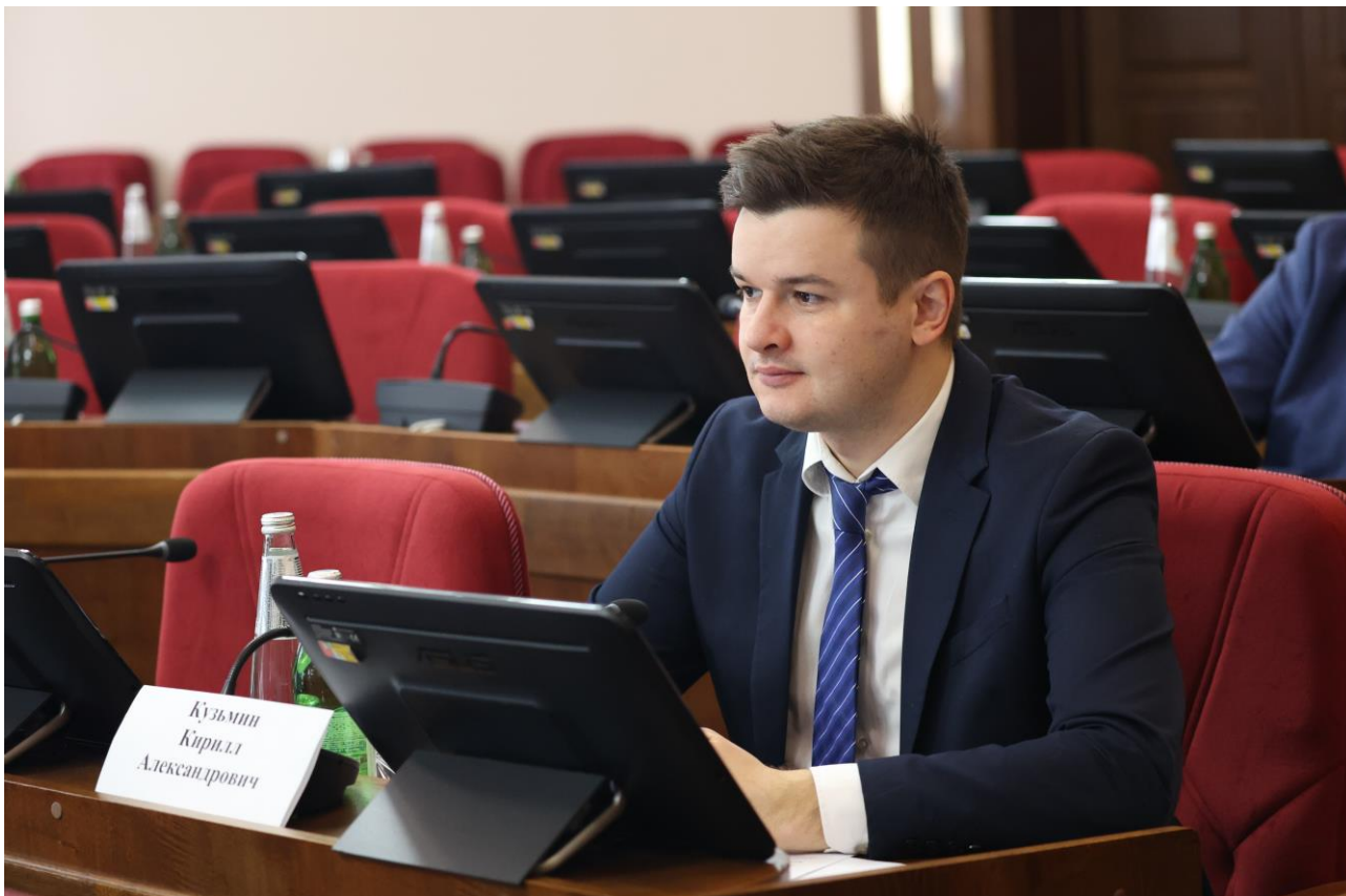
К.А. Кузьмин, Уполномоченный по защите прав предпринимателей в Ставропольском крае

Об информации о поступивших в Думу Ставропольского края по вопросам ведения комитета Думы Ставропольского края по экономическому развитию и собственности проектах федеральных законов, а также законодательных инициативах и обращениях законодательных органов других субъектов Российской Федерации;