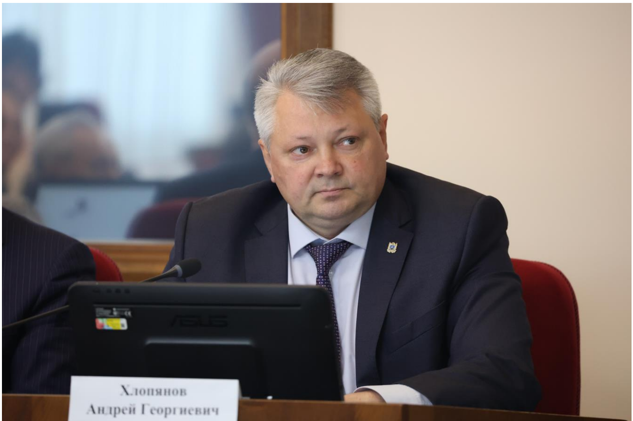
А.Г. Хлопянов, первый заместитель председателя Правительства Ставропольского края

О плане организационных мероприятий комитета Думы Ставропольского края по экономическому развитию и собственности на 2023 год;