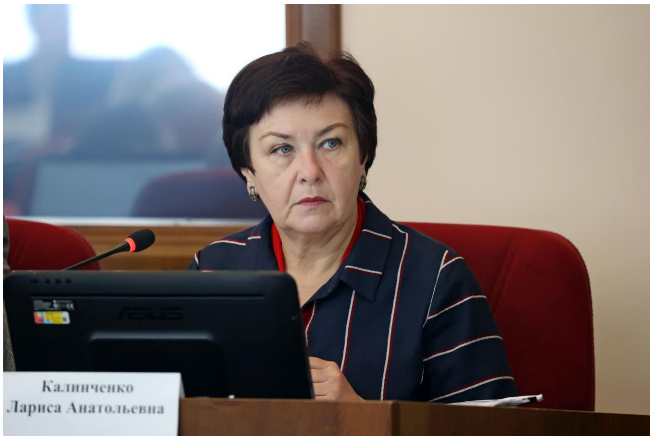
Л.А. Калинченко, заместитель председателя Правительства Ставропольского края – министр финансов Ставропольского края

14 февраля 2023 года рассмотрены вопросы: