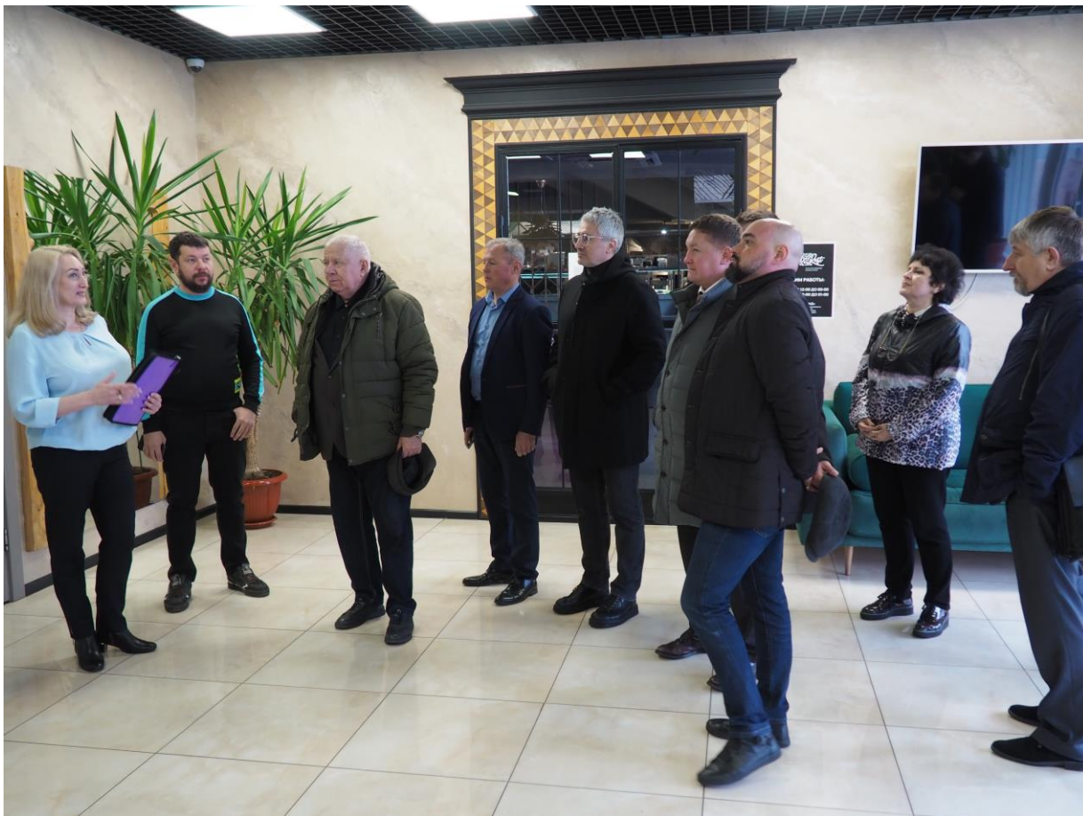
Выездное совещание комитета 24 марта 2023 года