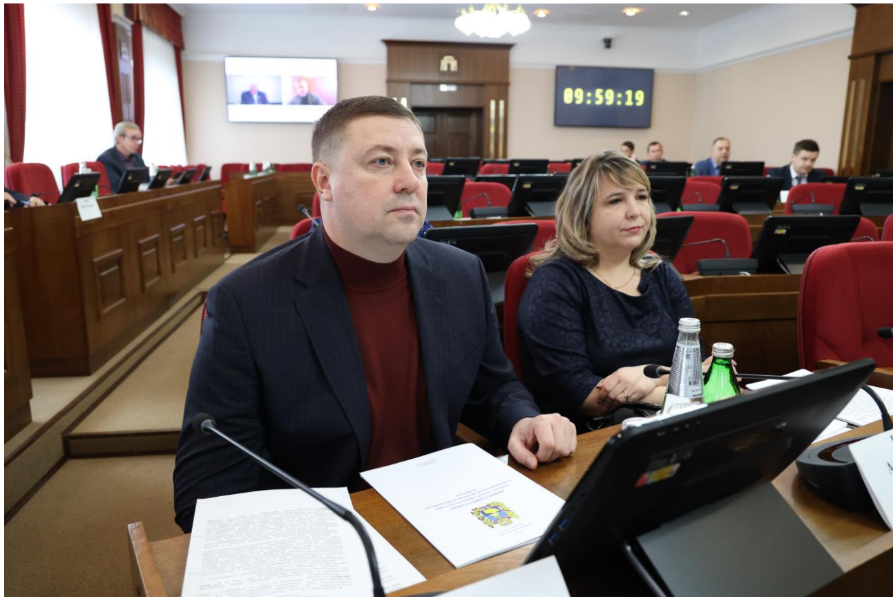
А.А. Мясоедов, министр имущественных отношений Ставропольского края

инициативах и обращениях законодательных органов других субъектов Российской Федерации;