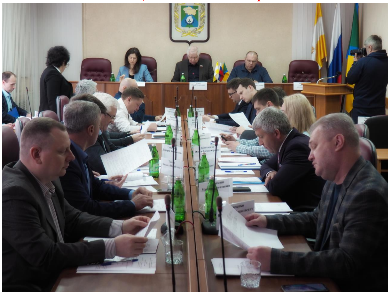
Выездное совещание комитета 24 марта 2023 года