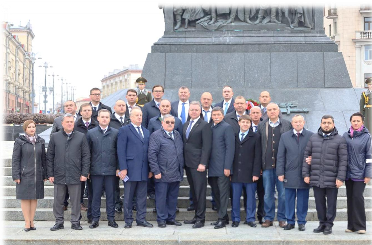
Республика Беларусь, г. Минск, ноябрь 2023 г.