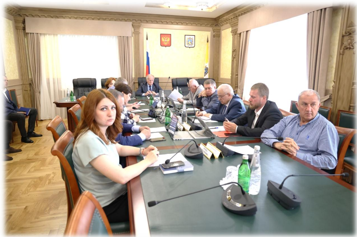
Заседание регионального координационного совета по обеспечению экономической стабильности, экономической и социальной поддержке населения, июнь 2023 г.