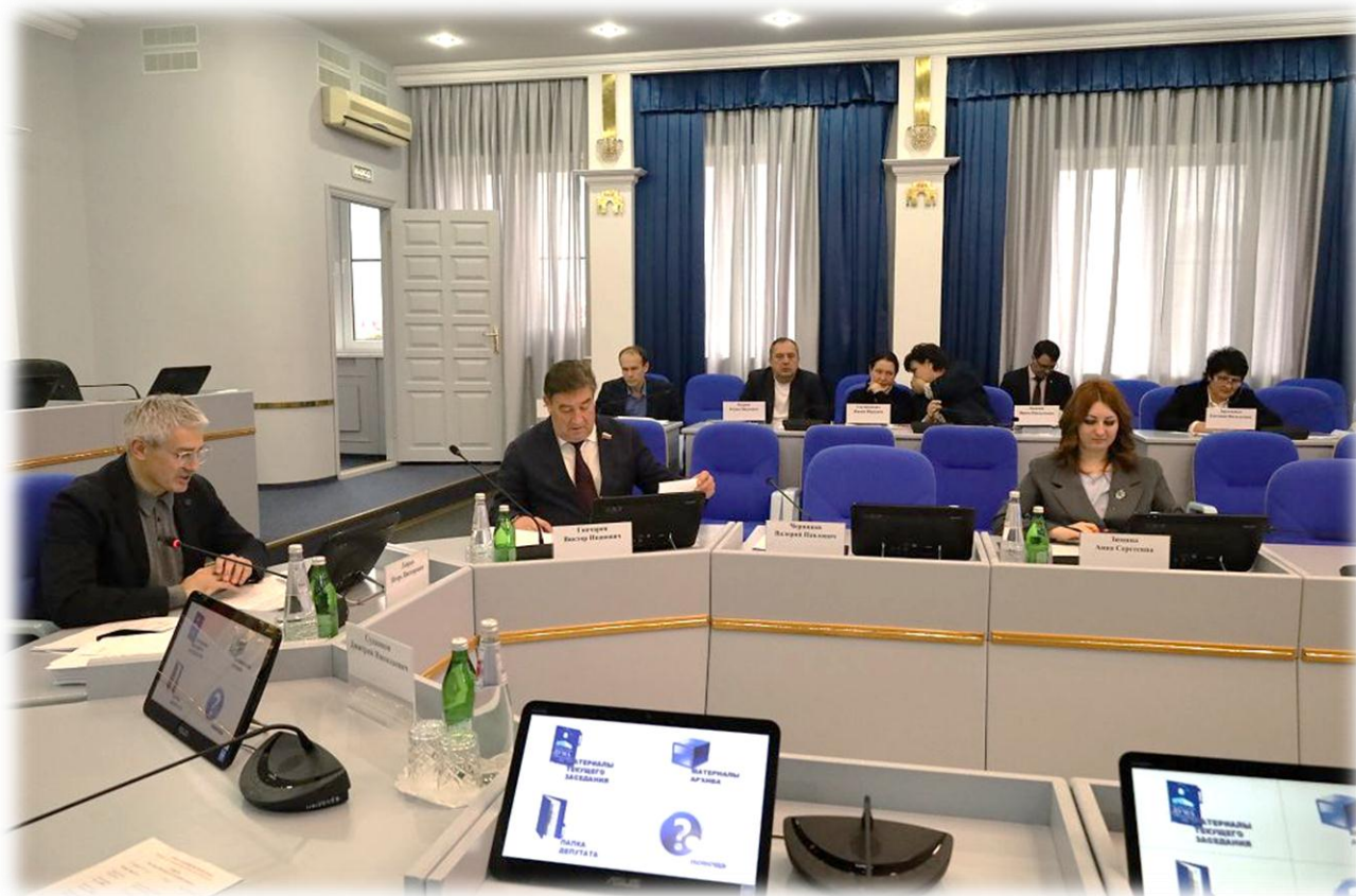
Заседание комитета Думы Ставропольского края по экономическому развитию и собственности, декабрь 2023 г.