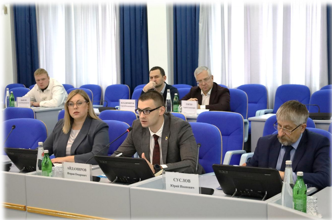
Заседание комитета Думы Ставропольского края по инвестициям, курортам и туризму, декабрь 2023 г.