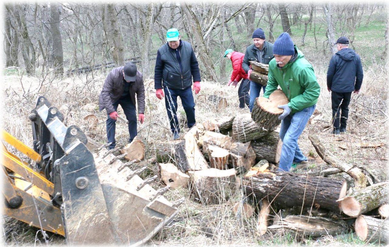
Депутаты Думы Ставропольского края на субботнике, март 2023 г.