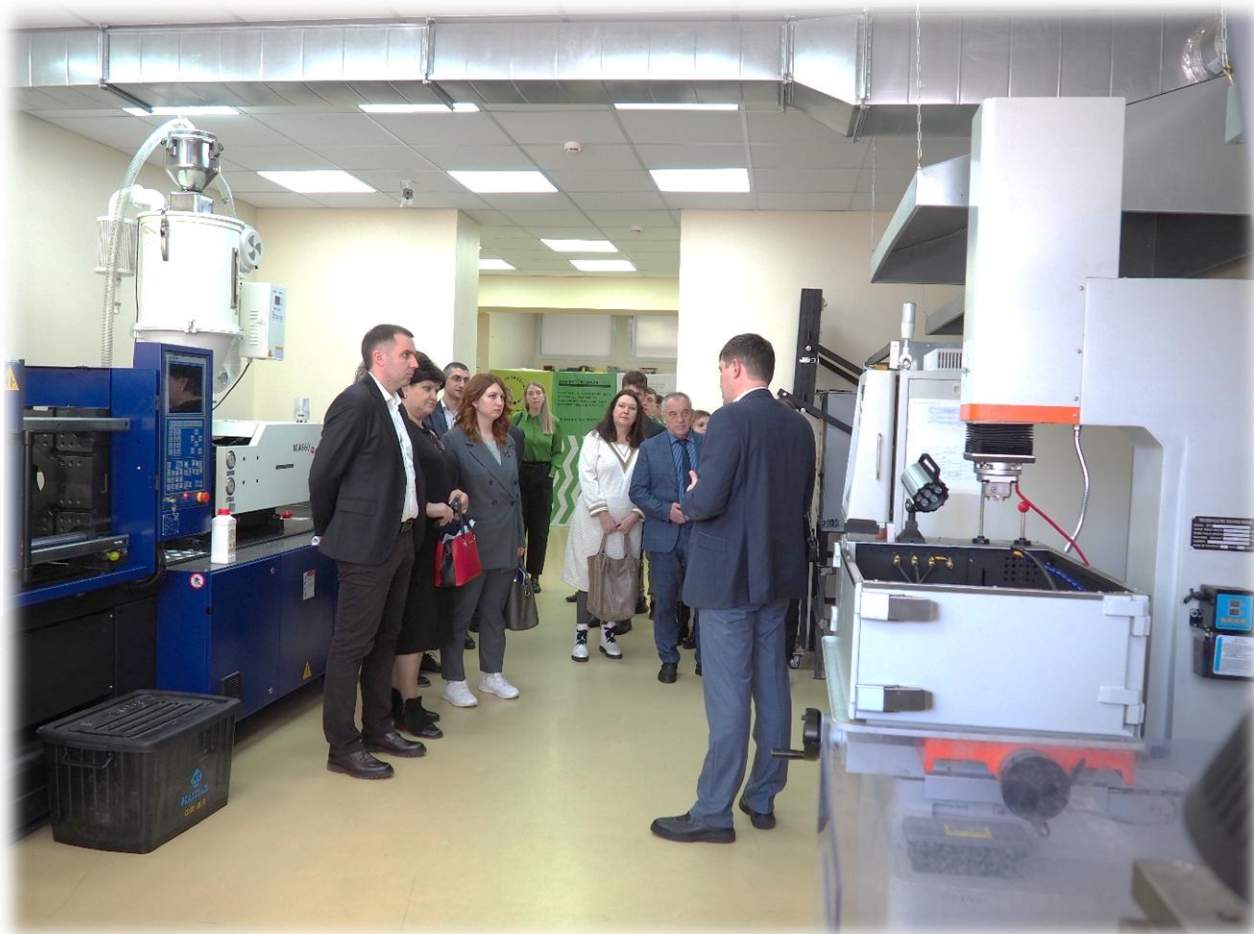
Центр молодежного инновационного творчества "Фаблаб "Вектор", СТГАУ, г. Ставрополь

По рекомендации участников совещания министерством экономического развития Ставропольского края был актуализирован список инновационных предприятий Ставропольского края.