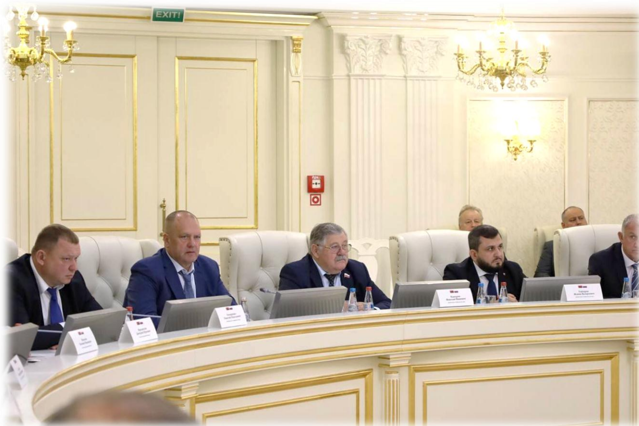
Заседание рабочей группы по сотрудничеству Ставропольского края и Республики Беларусь, г. Минск, ноябрь 2023 г.