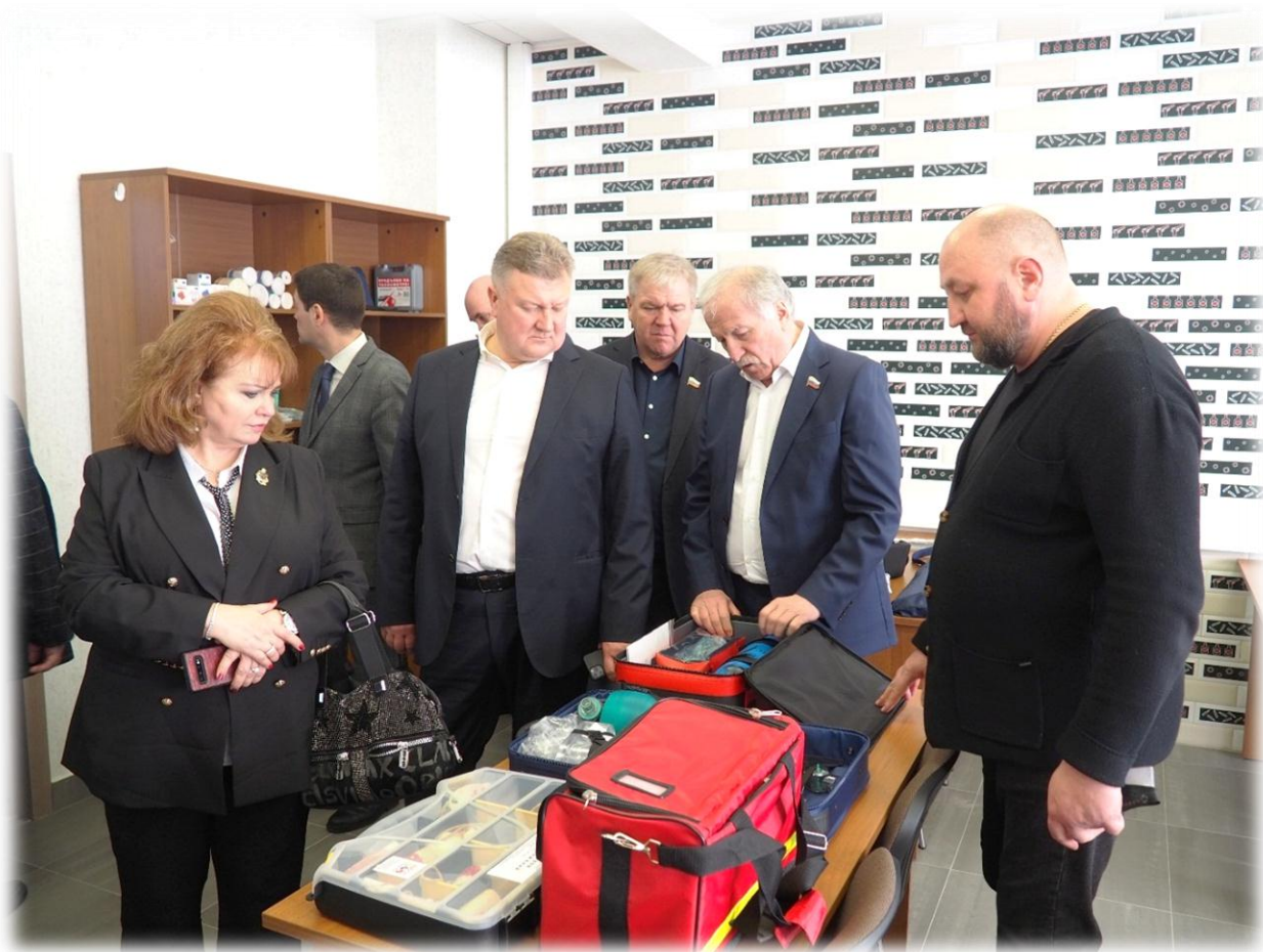
Посещение депутатами Думы Ставропольского края центра военно-спортивной подготовки и патриотического воспитания, январь 2023 г.