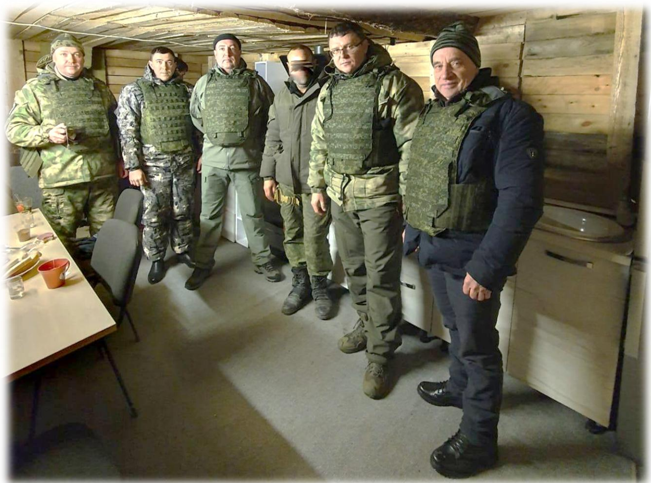
Доставка гуманитарных грузов в зону СВО, февраль 2023 г.