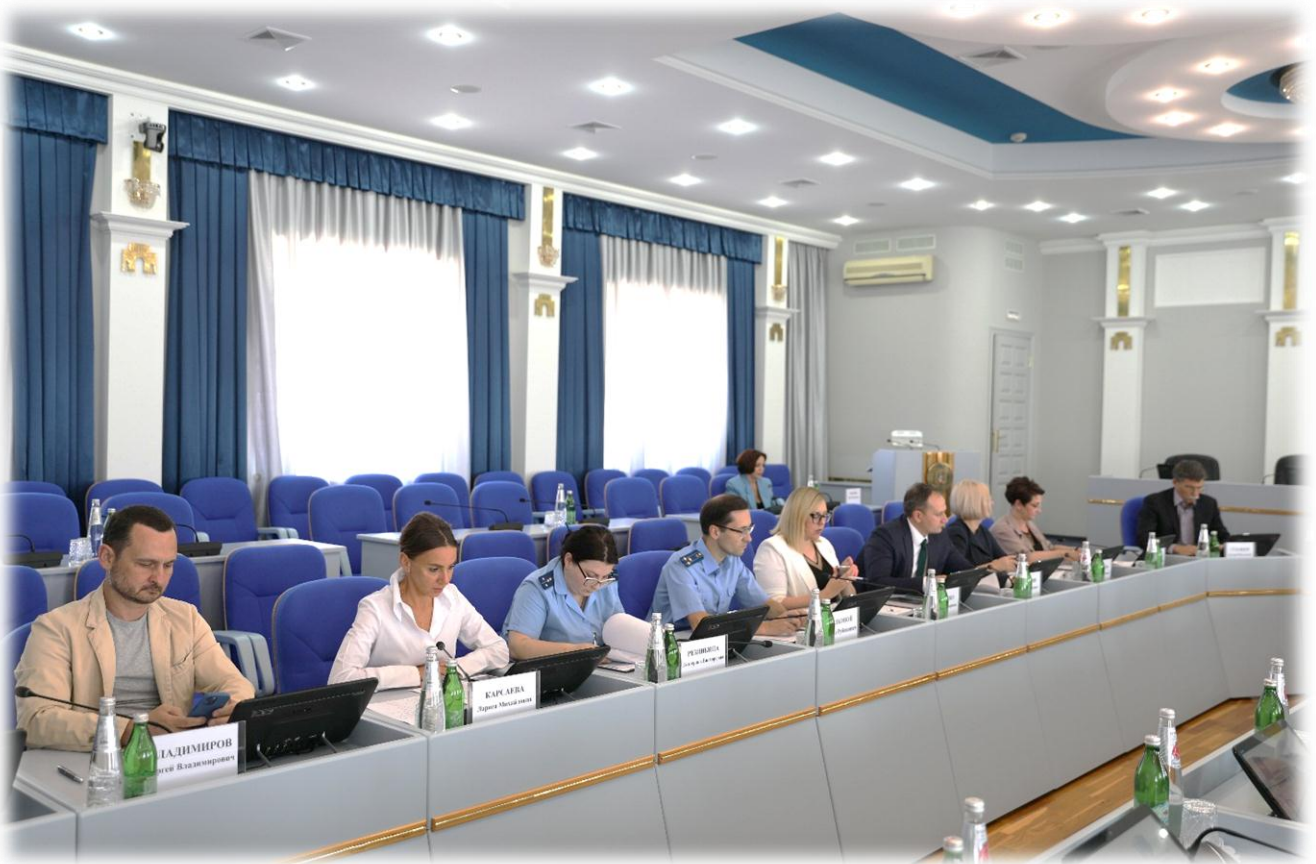
Заседание комитета, июнь 2023 г.