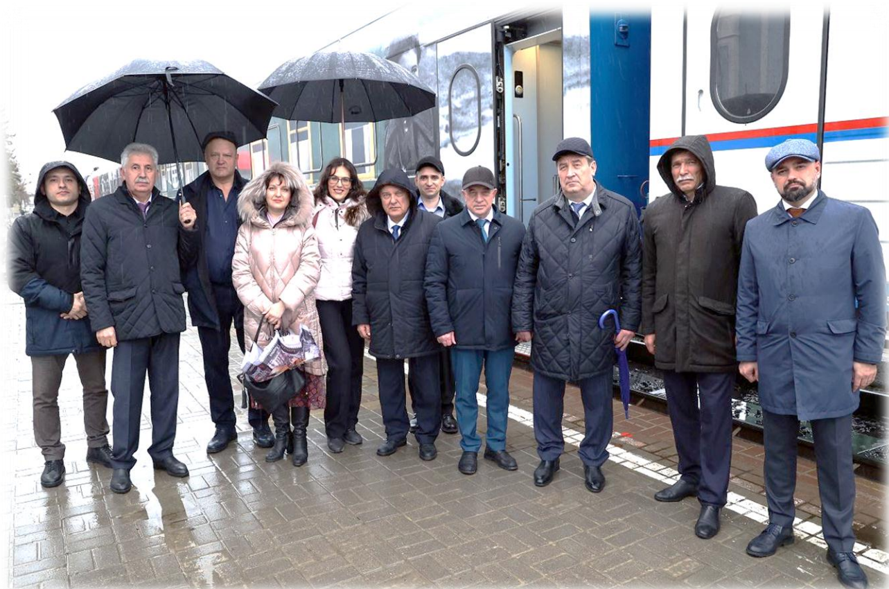
Посещение депутатами Ставропольского края передвижного музея "Поезд Победы", март 2023 г.