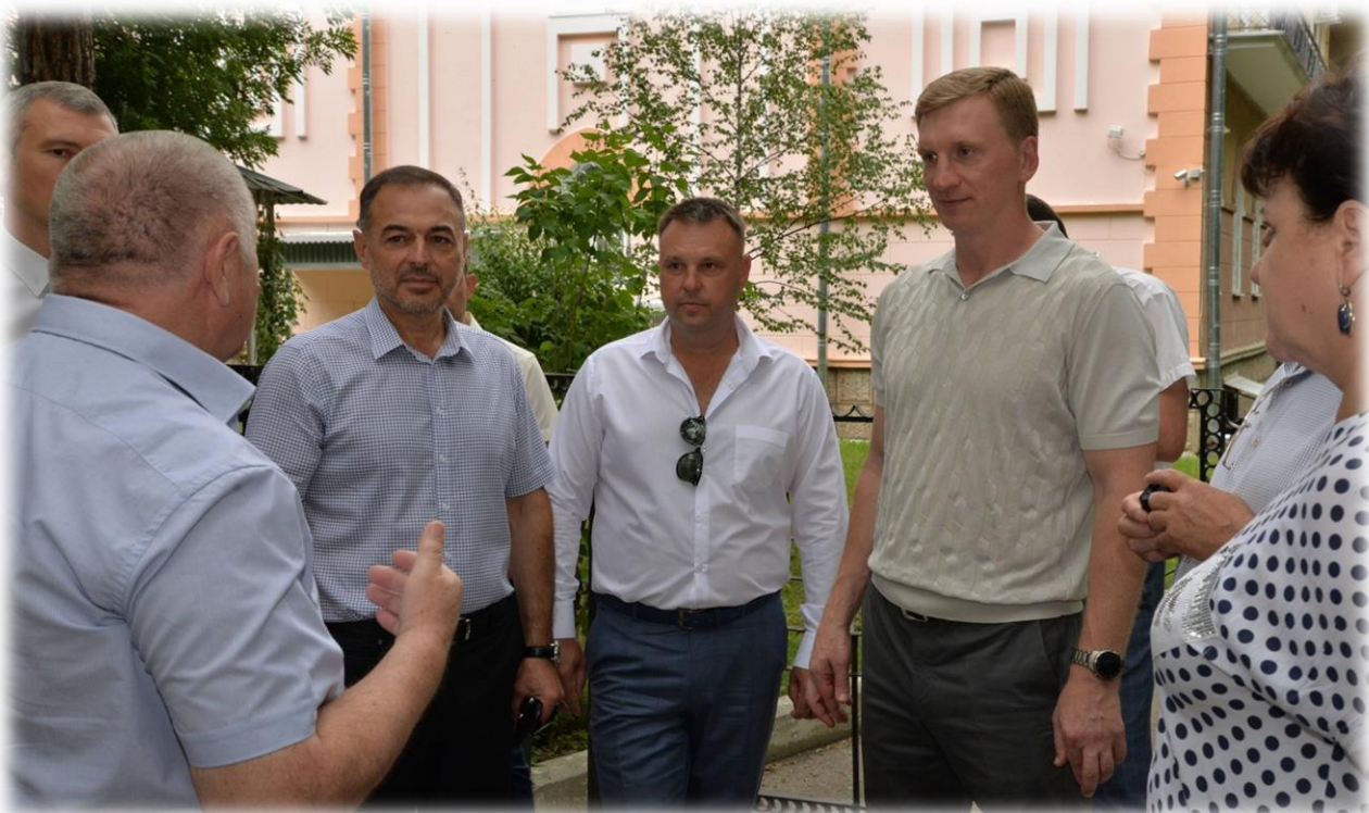
Осмотр курортного парка города - курорта Ессентуки 14 июля 2020 года