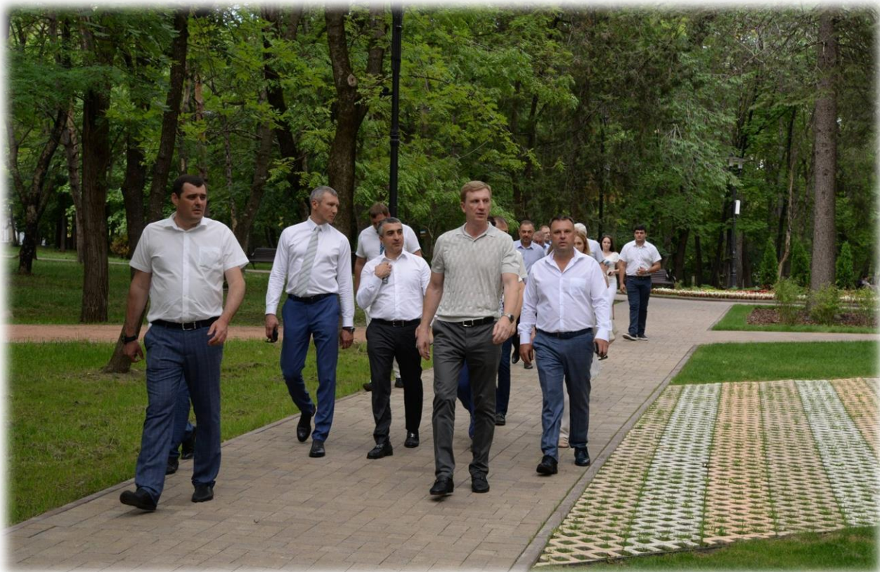
Осмотр курортного парка города - курорта Ессентуки 14 июля 2020 года