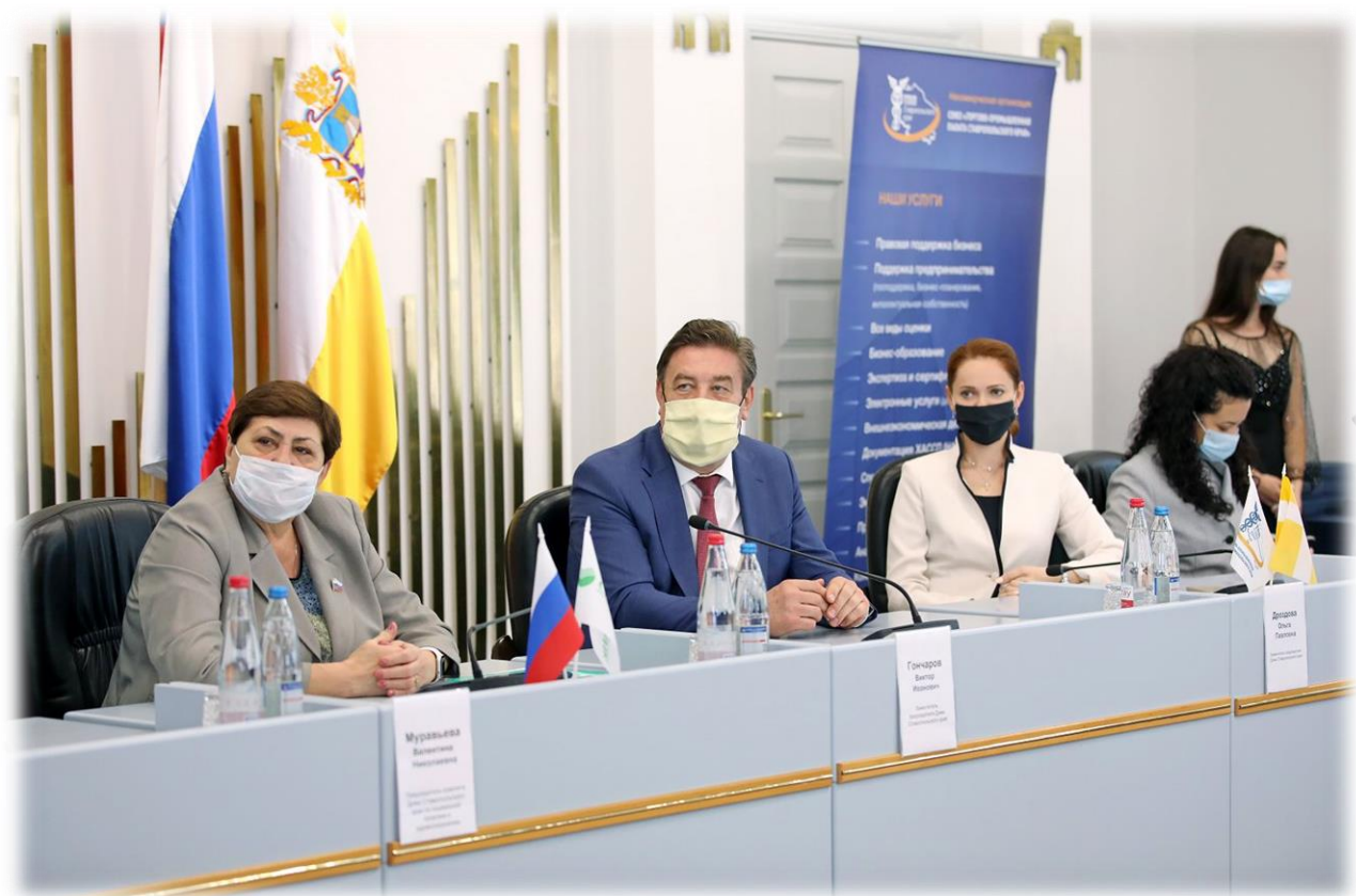
VII ежегодный конкурс среди предпринимателей "Бренд Ставрополя" 25 сентября 2020 г.