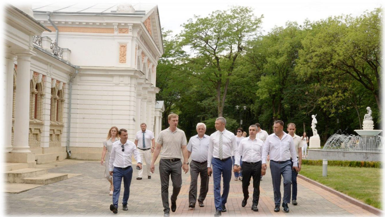
Осмотр курортного парка города - курорта Ессентуки 14 июля 2020 года