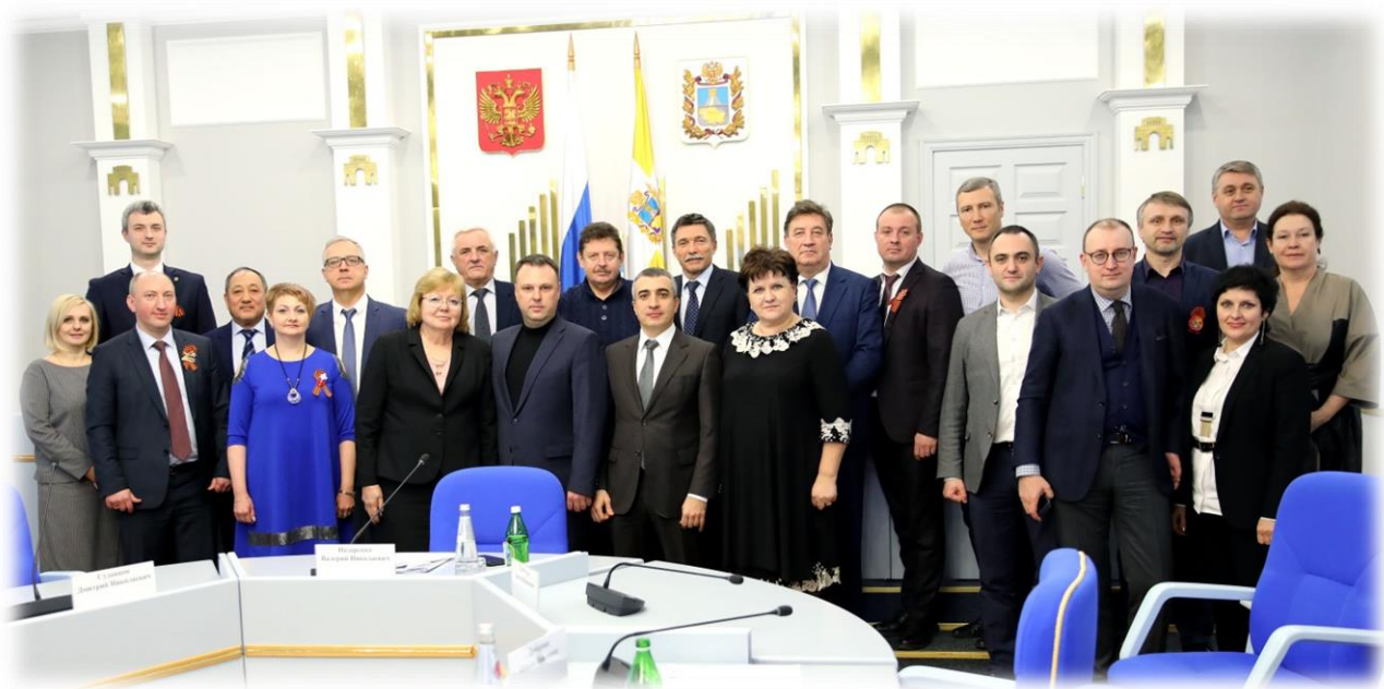
Заседание комитета 22 января 2020 года