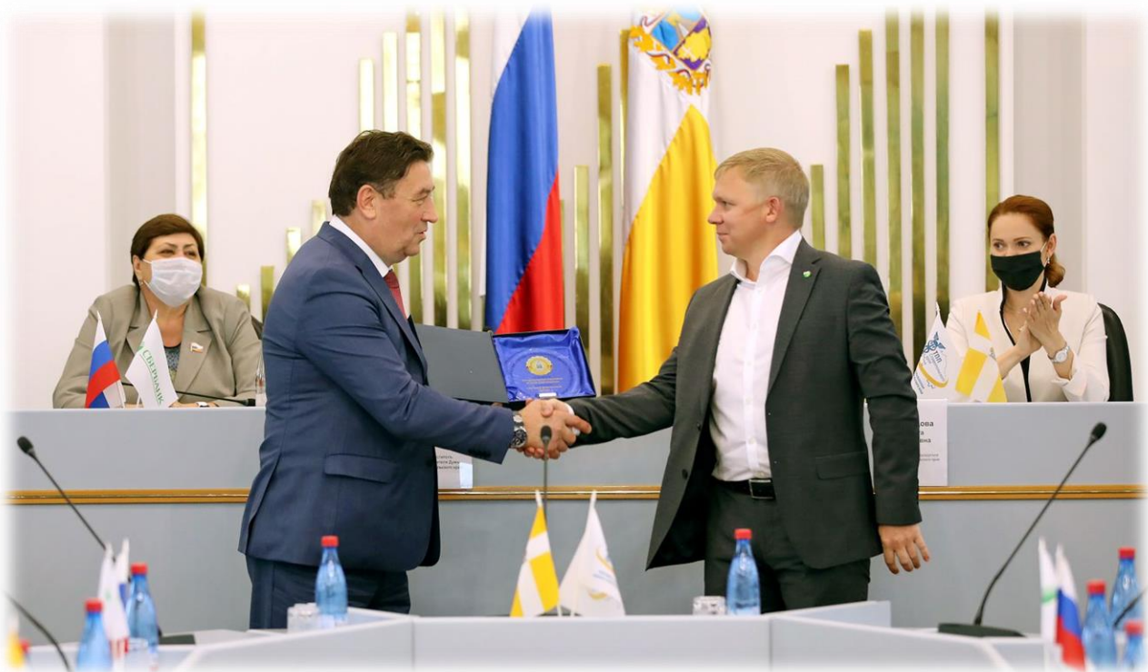
VII ежегодный конкурс среди предпринимателей "Бренд Ставрополя" 25 сентября 2020 г.