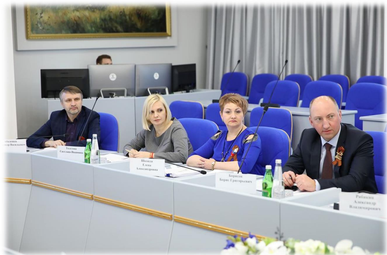
Заседание комитета 22 января 2020 года