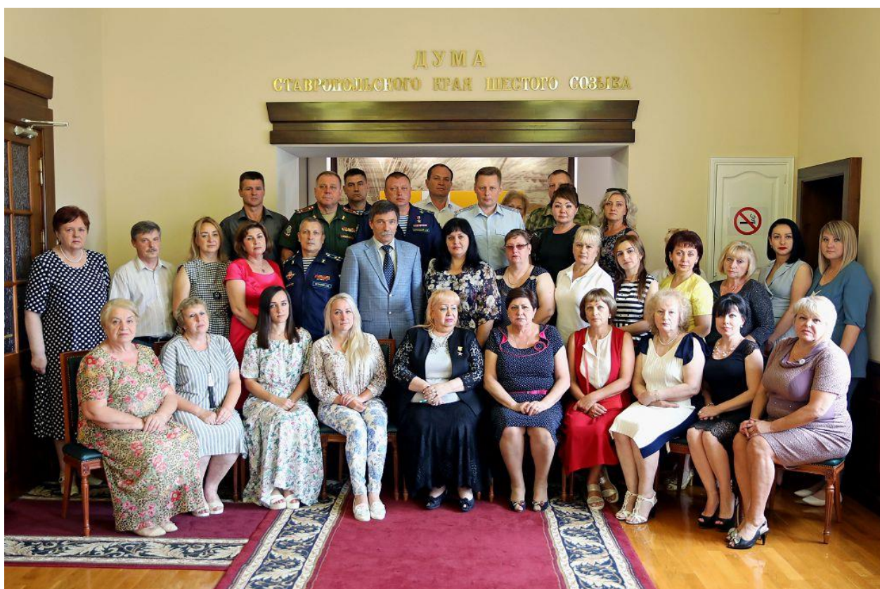
Участники торжественного приема в Думе Ставропольского края вдов защитников Отечества, погибших при исполнении служебных обязанностей

Все участники приема получили памятные подарки.