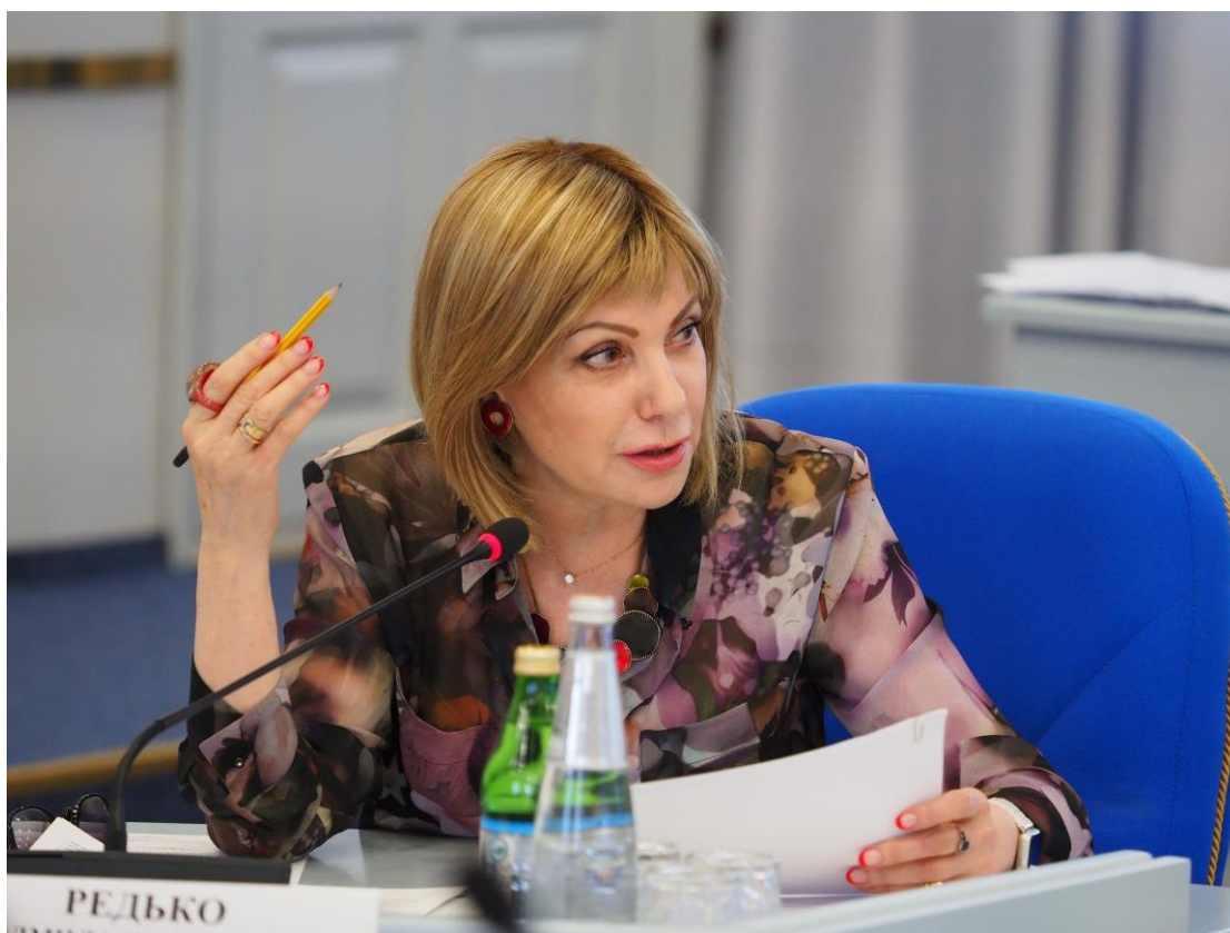
Редько Л.А. на заседании комитета

О согласовании представления Генерального прокурора Российской Федерации Ю.Я. Чайки о назначении Лоренца А.А. на должность прокурора Ставропольского края.