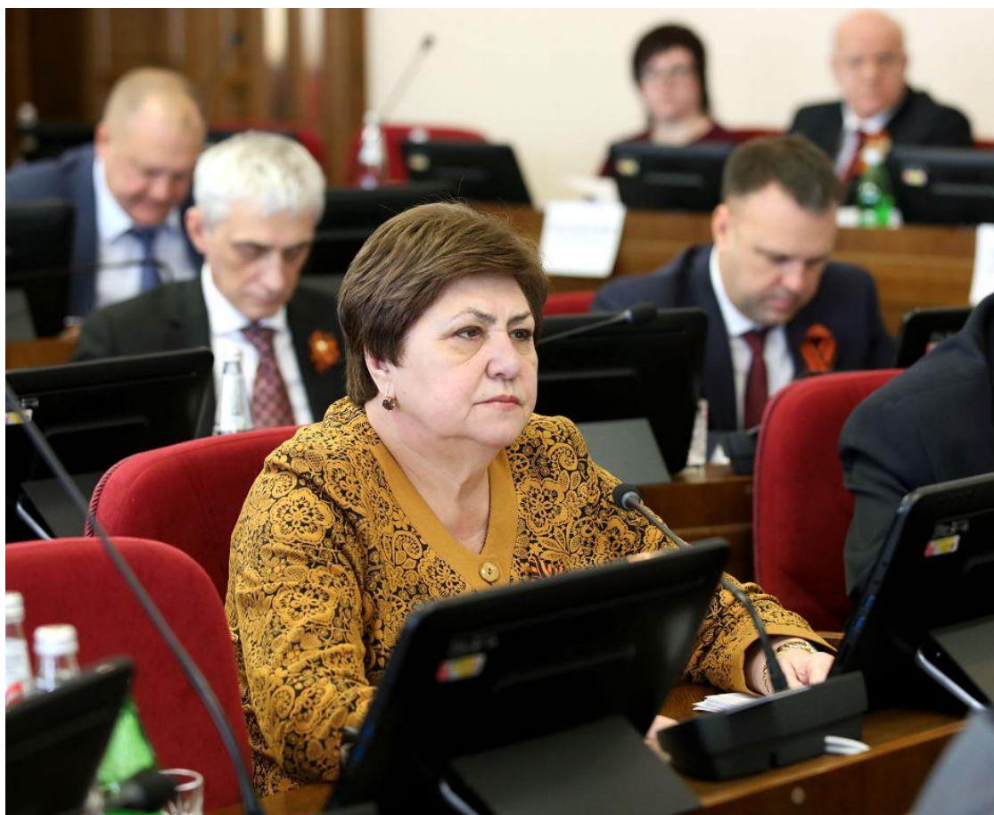
Председатель комитета Муравьева В.Н. на заседании Думы Ставропольского края