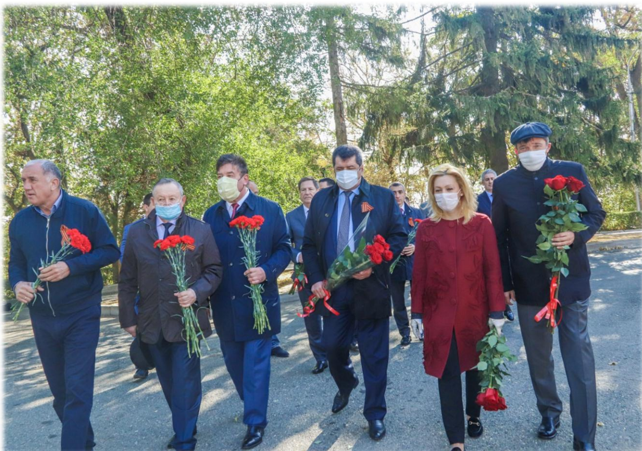
Межрегиональный парламентский форум "Наша память. Наша гордость. Битва за Кавказ"