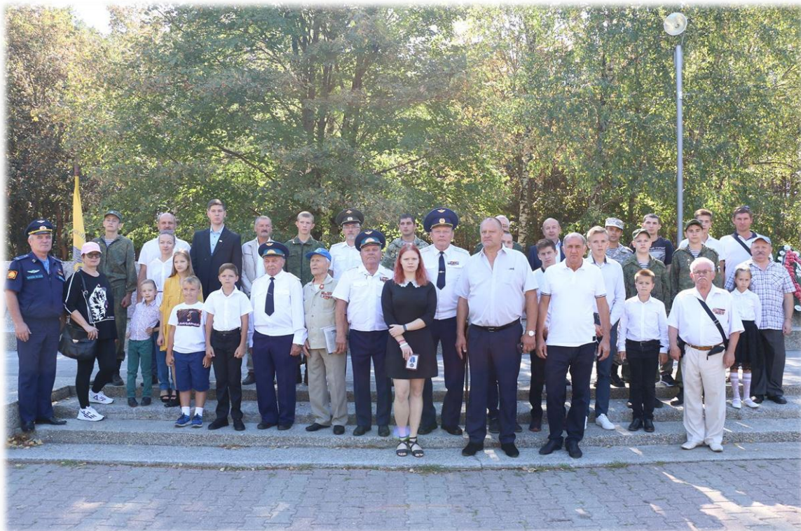
Поддержка и возрождение поискового движения