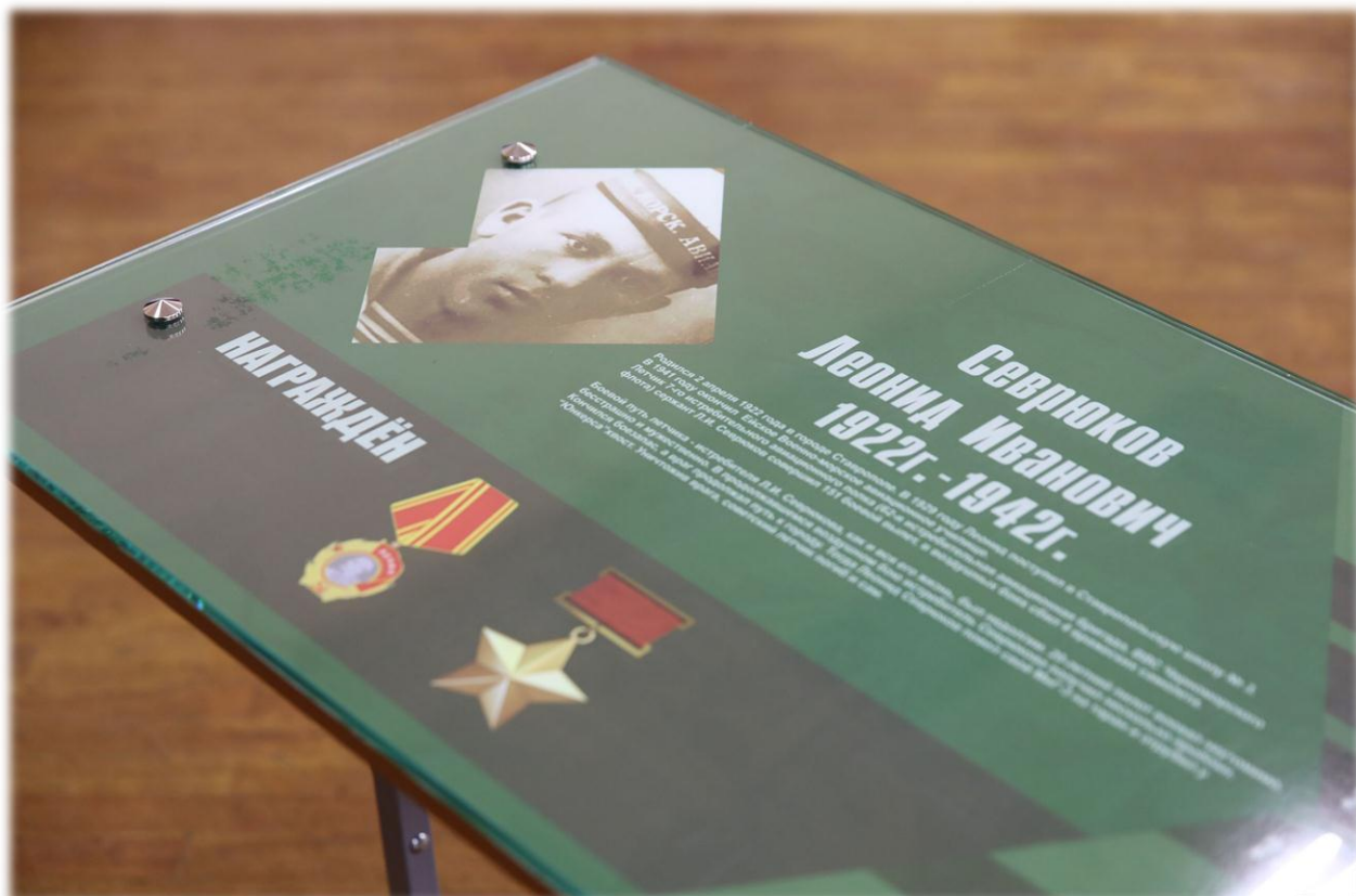
Акция «Школьная парта Героя»