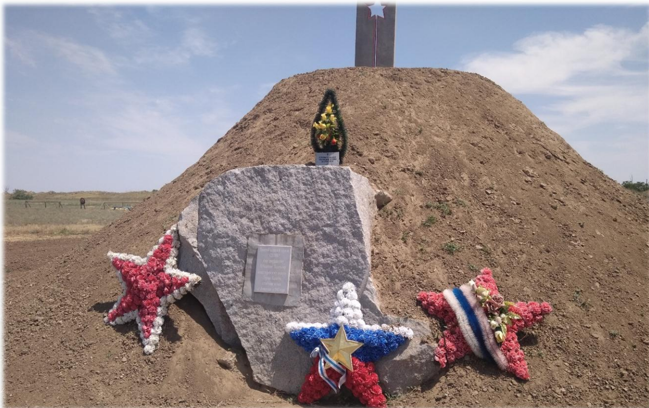
"Населенный пункт воинской доблести" - село Ачикулак Нефтекумского района