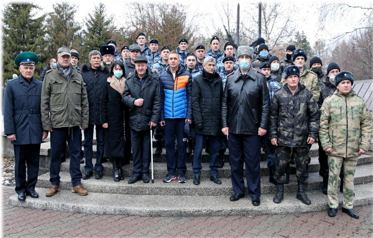
Возложение цветов в ставропольском сквере памяти земляков, погибших в боях при исполнении воинского долга