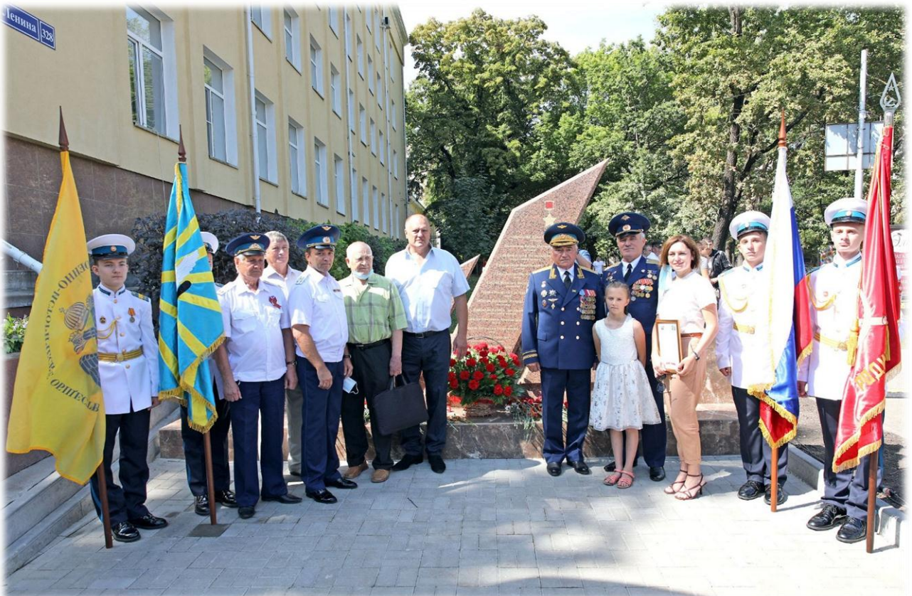
Торжественное мероприятие, посвященное открытию мемориала героям-авиаторам