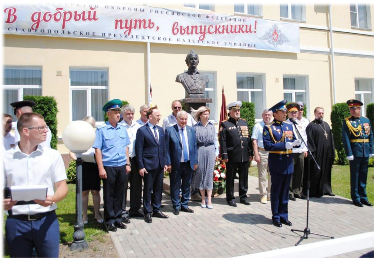
Выпуск в президентском кадетском корпусе «Честь имею-Родине служить»