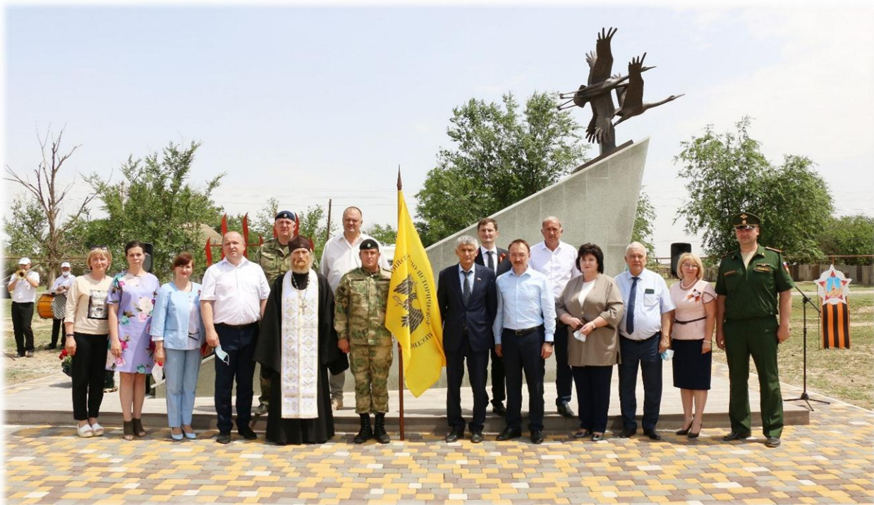
Мероприятие, посвященное открытию памятника «Журавли»