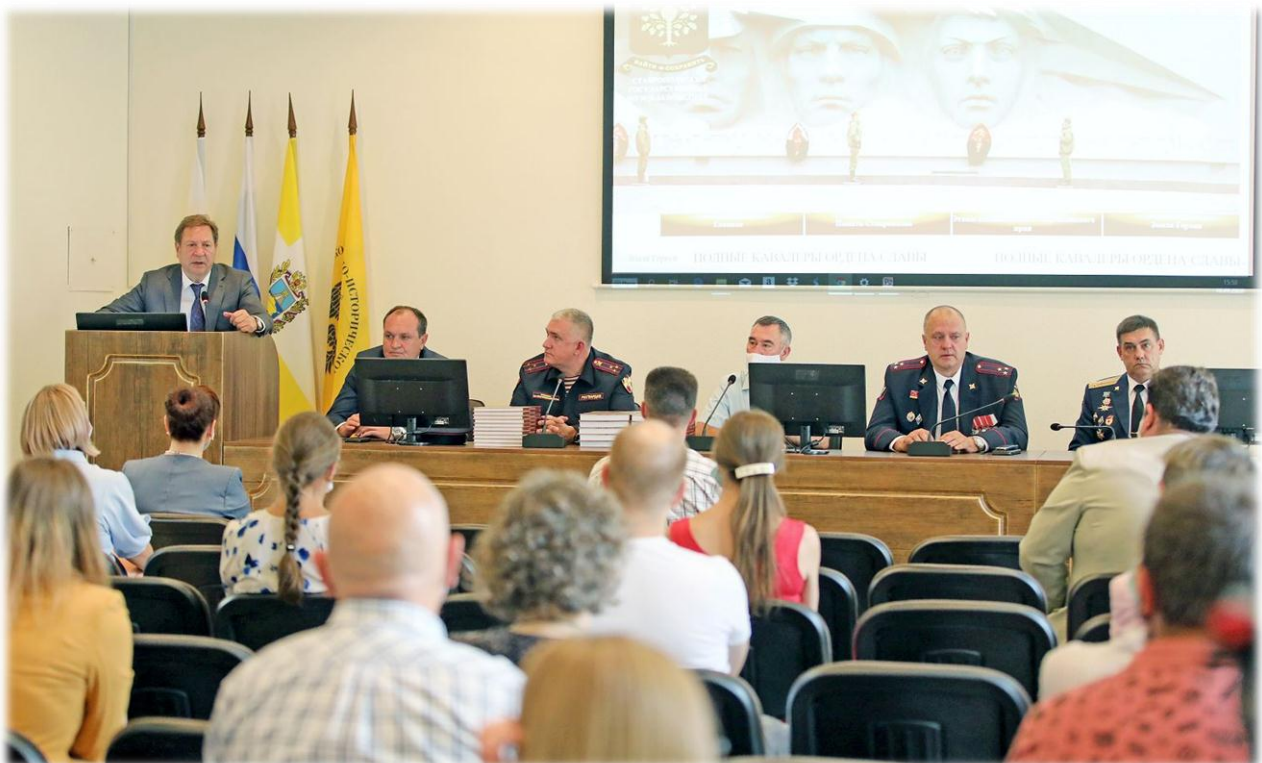
Презентация книги о полных кавалерах орденов Славы «Трижды прославленные»