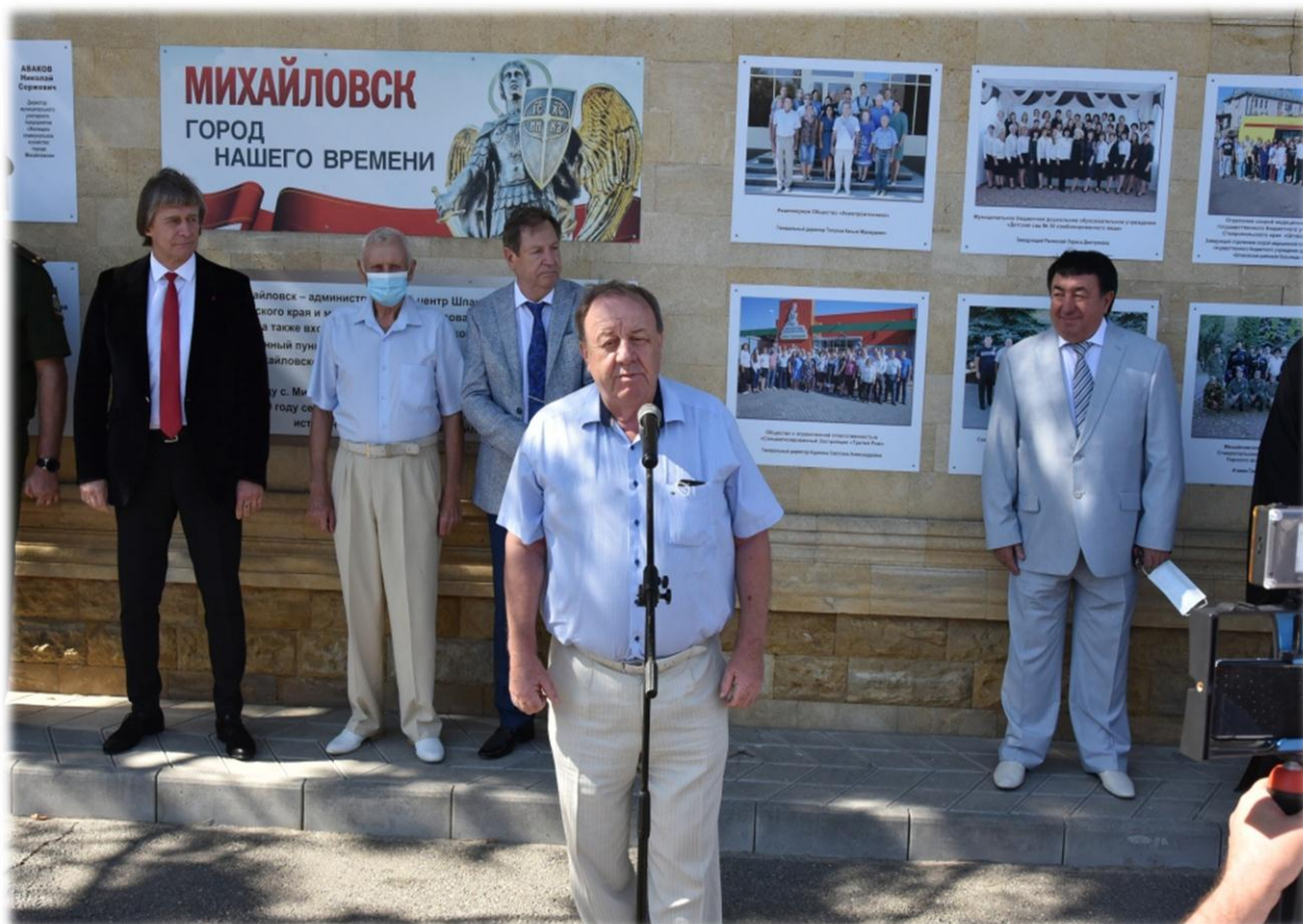
Открытие городской доски почета