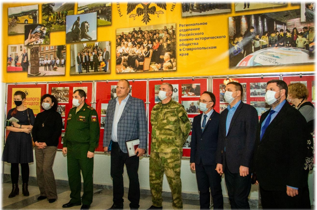
Торжественное мероприятие «Без прошлого нет будущего»