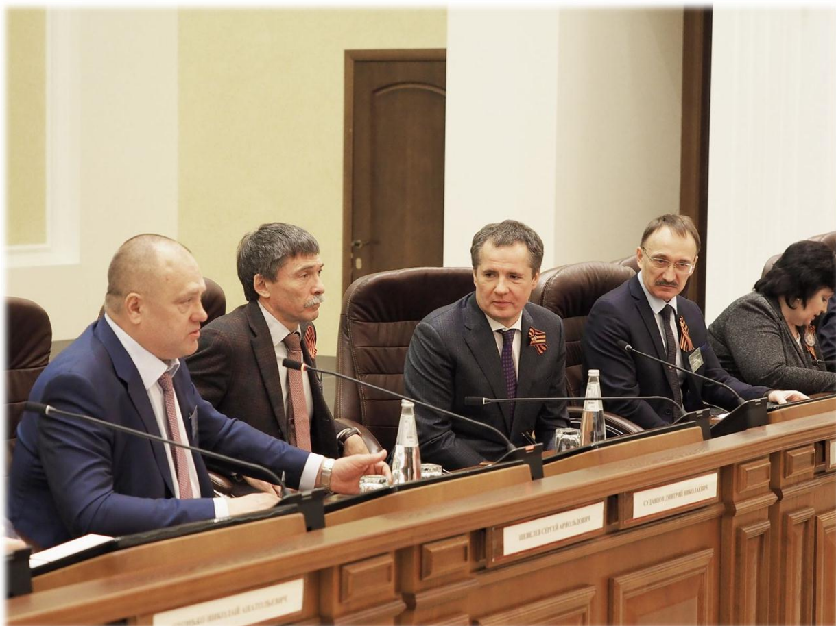
Международная научно-практическая конференция «Не допустить переписывания истории»