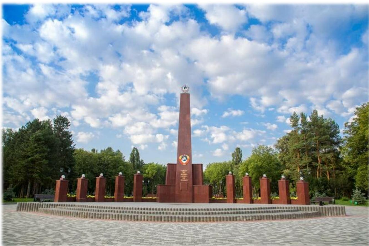
"Город военно-исторического наследия" – город-курорт Пятигорск