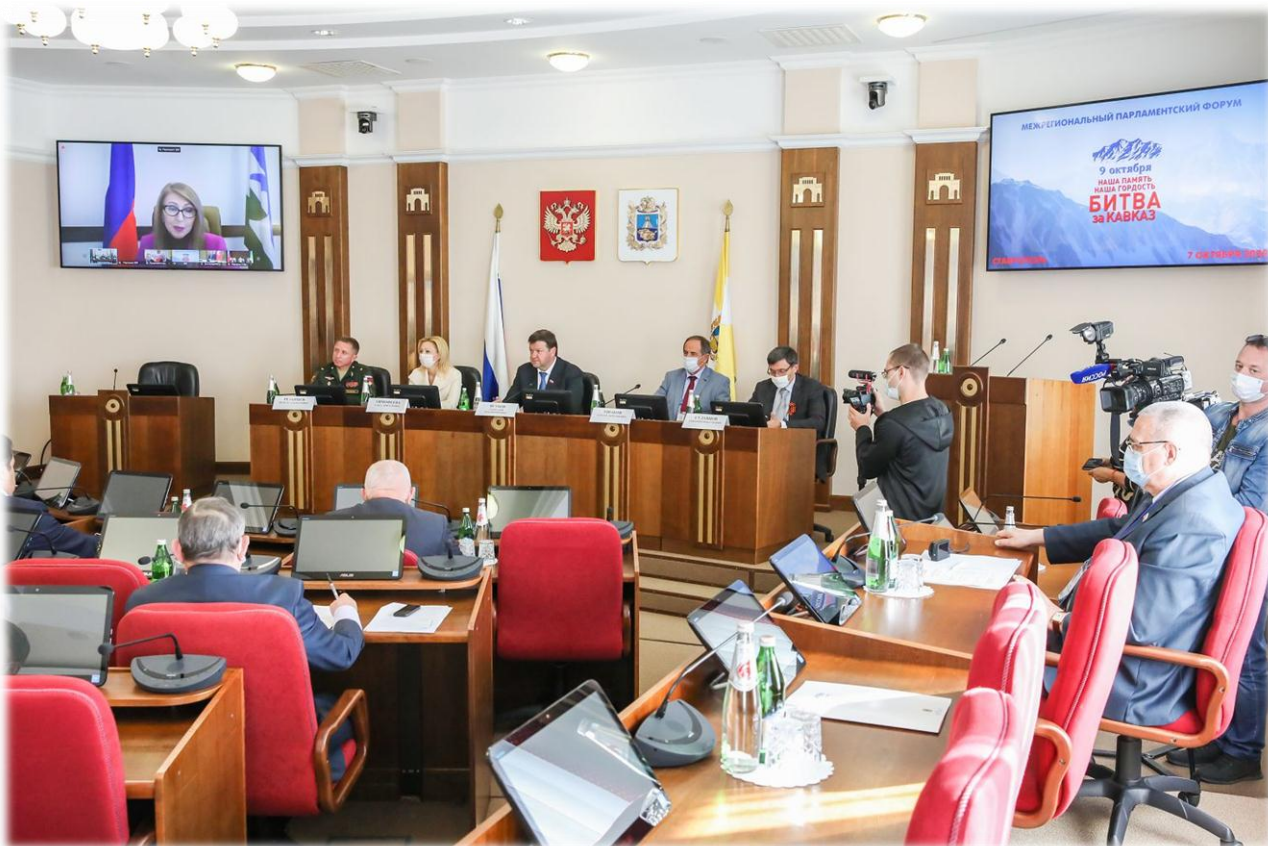
Межрегиональный парламентский форум "Наша память. Наша гордость. Битва за Кавказ"