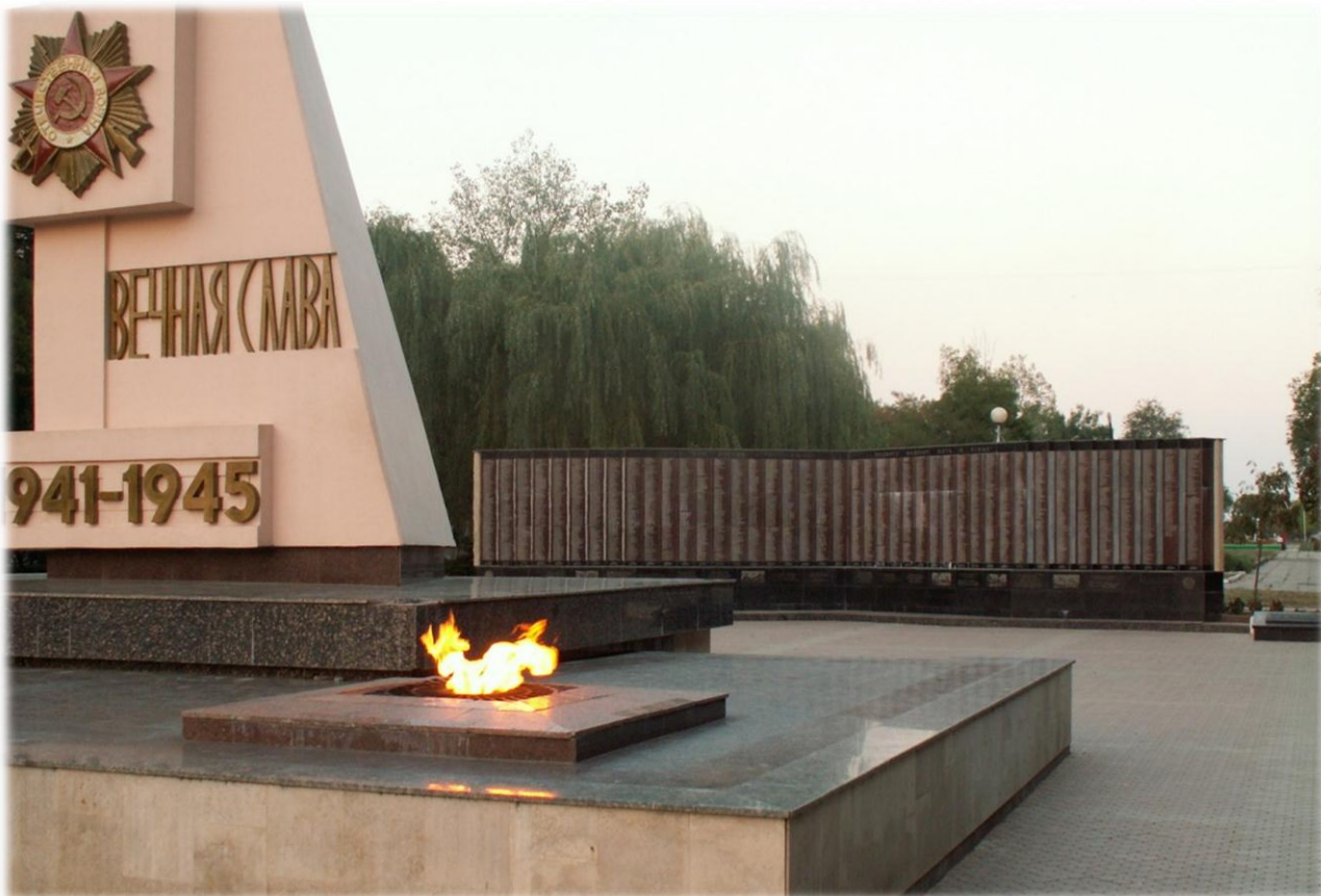
"Город воинской доблести" - город Невинномысск