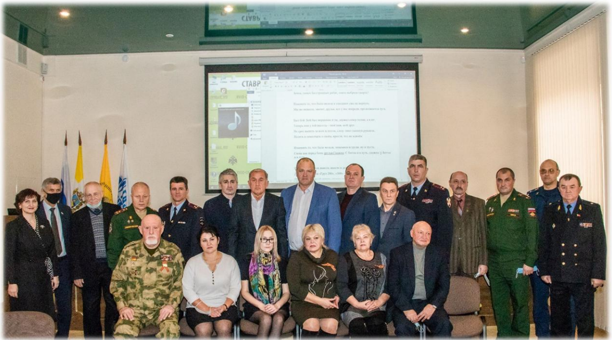
Круглый стол, посвященный Дню неизвестного солдата