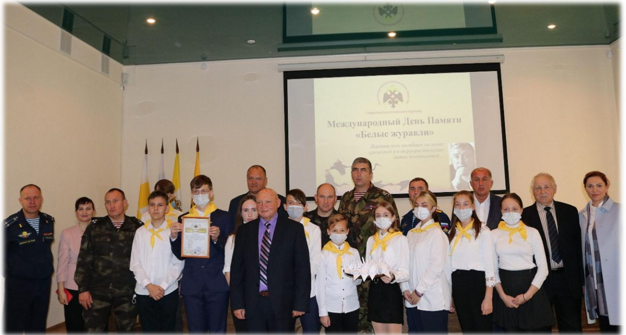
Мероприятие, посвященное памяти воинов, погибших в Великой Отечественной войне и в других военных конфликтах, приуроченное ко Дню белых журавлей