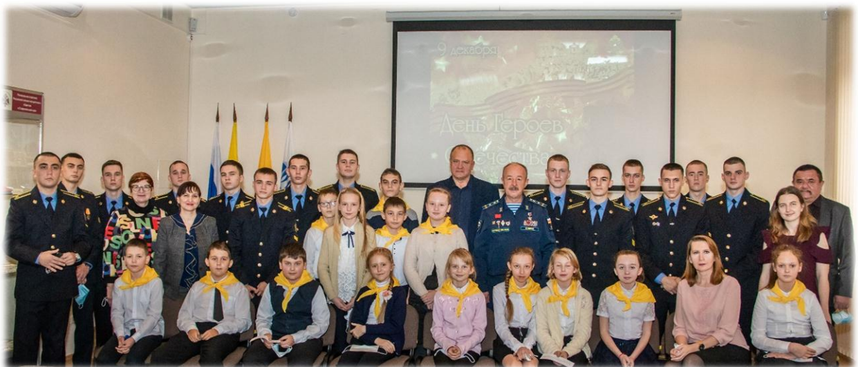
Круглый стол, посвященный Дню Героев Отечества г. Ставрополя