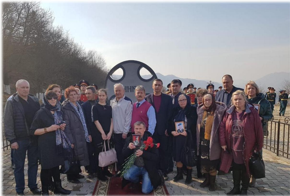
Мероприятия, посвящённые павшим воинам-десантникам, в городе Грозном и селе Улус-Керт Чеченской Республики