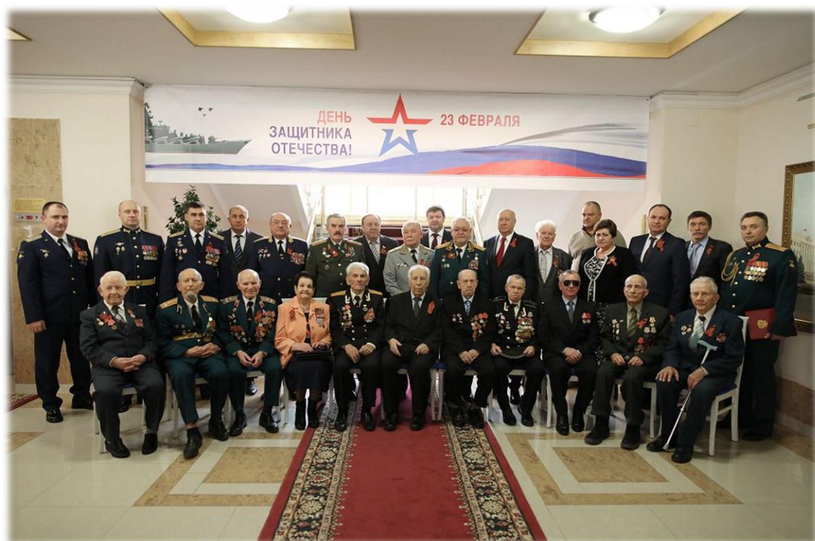
Мероприятия, посвященного Дню защитника Отечества