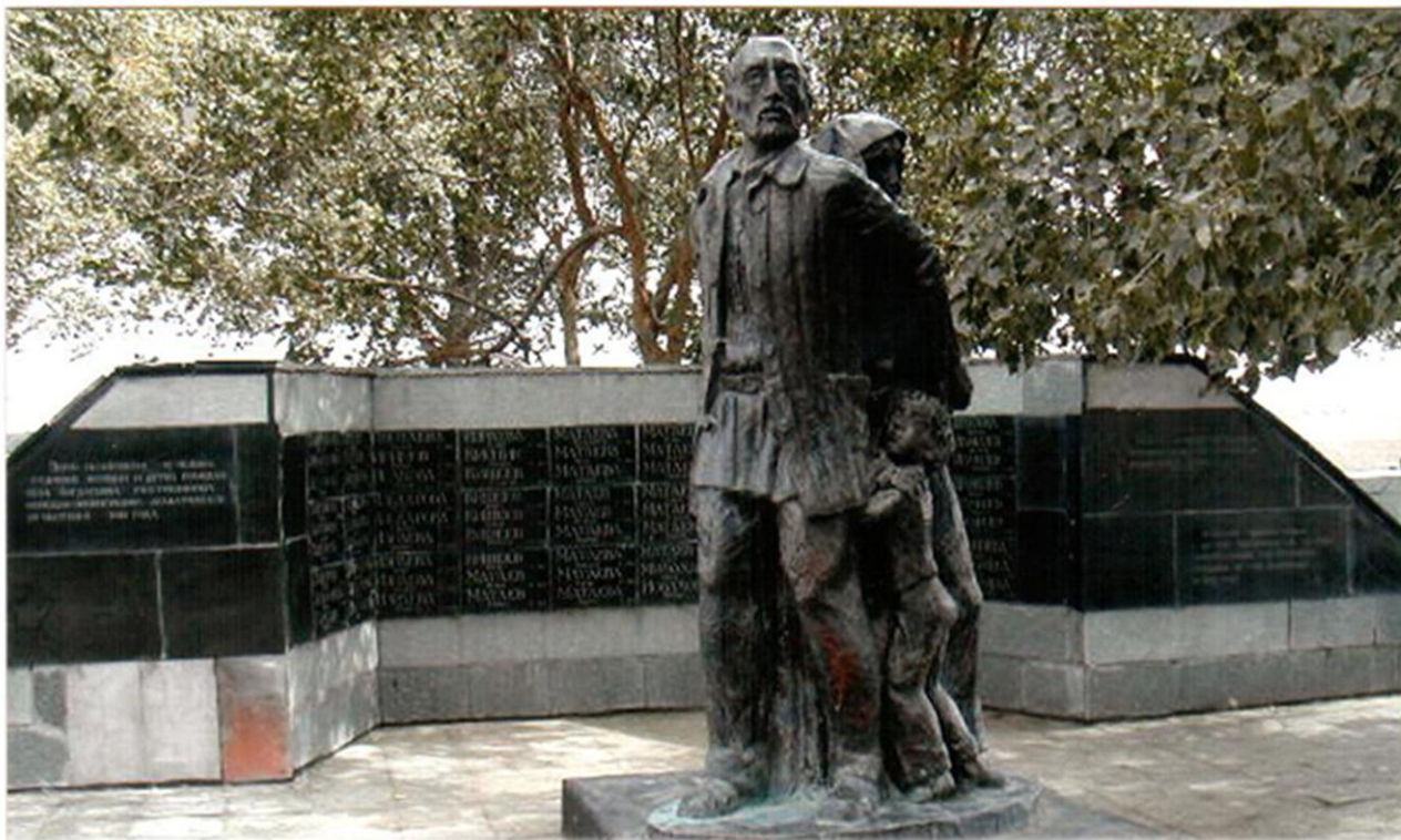
"Рубеж воинской доблести" - село Богдановка и хутор Сунженский Степновского района