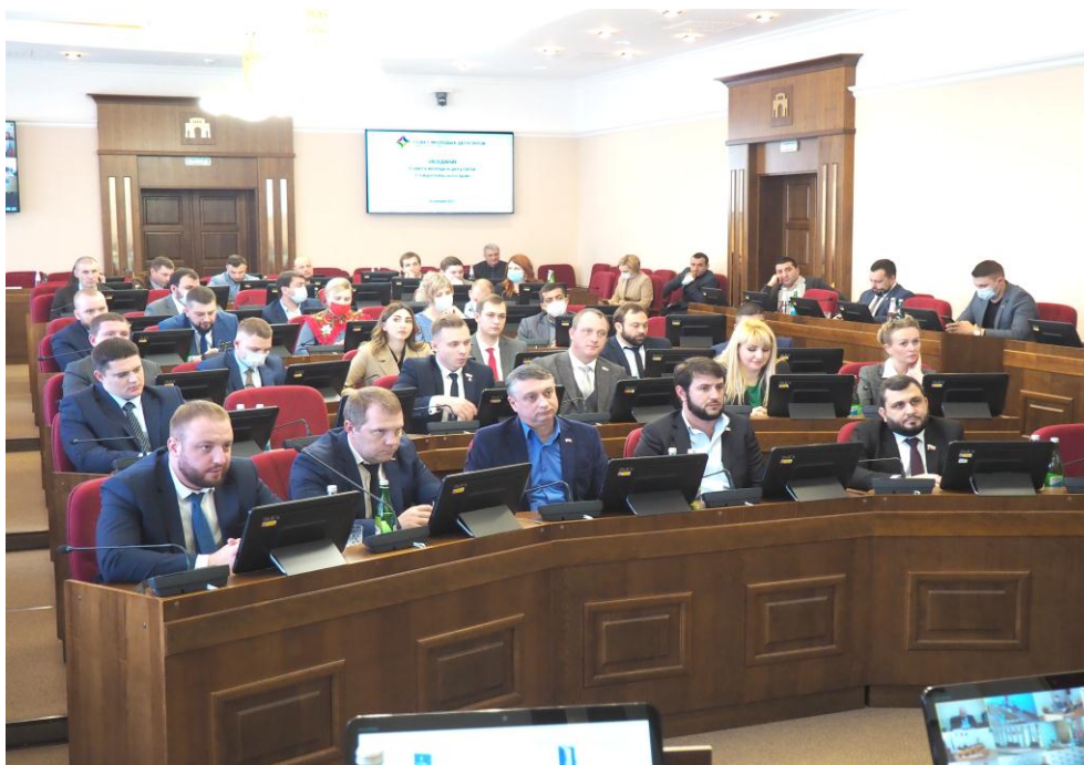
Участники заседания – члены Совета молодых депутатов Ставропольского края