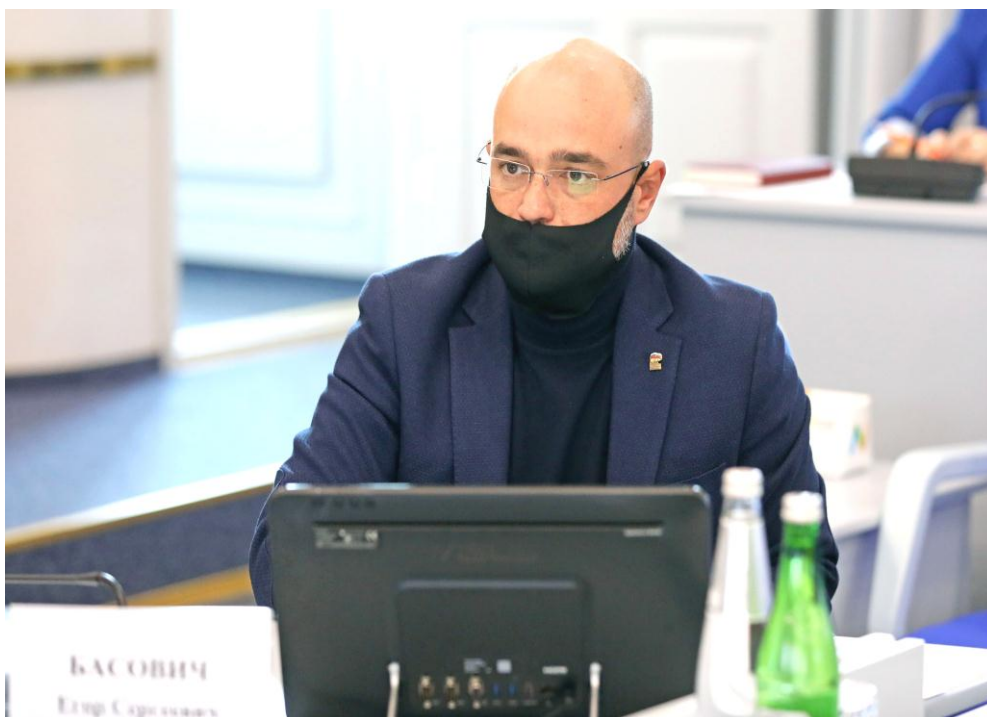
Е.С. Басович на заседании комитета

О наделении полномочиями сенатора Российской Федерации – представителя от Думы Ставропольского края