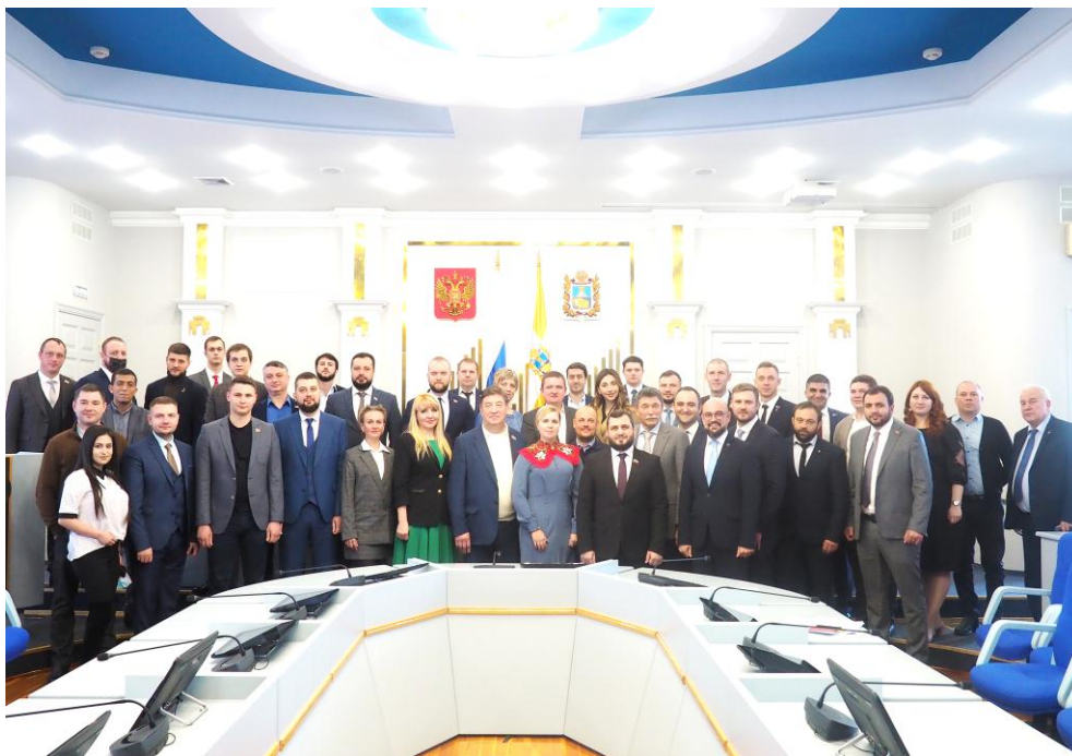
Участники заседания Совета молодых депутатов Ставропольского края

В ходе заседания рассмотрен вопрос об образовании девяти комитетов Совета, которые по функциям совпадают с комитетами краевой Думы. Молодые депутаты утвердили кандидатуры их председателей и приняли план работы Совета на 2022 год.