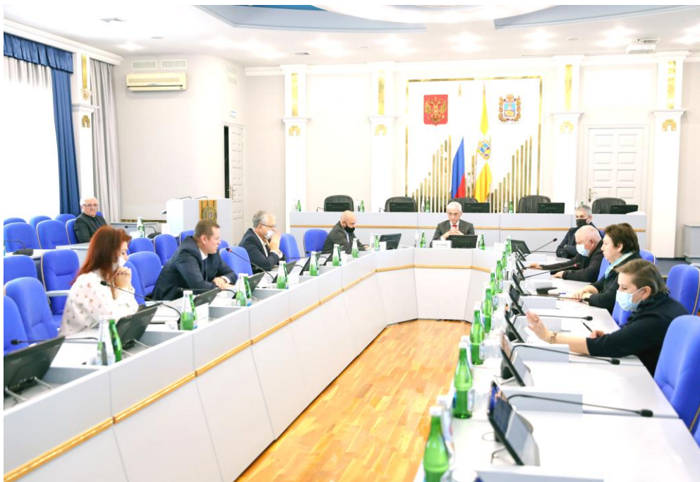
Совещание в комитете

Для реализации законопроекта в случае его принятия выделение дополнительных средств из бюджета края не потребуется.