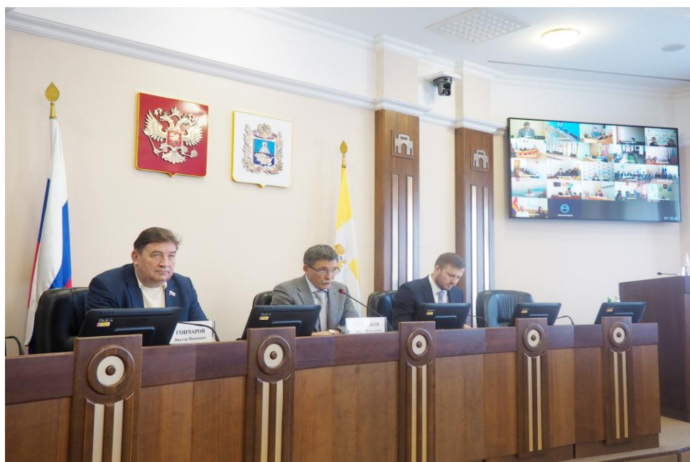
Первые заместители председателя Думы Ставропольского края Д.Н. Судаццов и В.И. Гончаров, заместитель председателя Правительства Ставропольского края Д.А. Давыдов и члены Совета молодых депутатов Ставропольского края на открытии первого заседания в режиме ВКС

В мероприятии также приняли участие председатель комитета по законодательству, государственному строительству и местному самоуправлению Ю.А. Скворцов, краевые депутаты А.С. Зими́на и Ж.В. Гончаров.