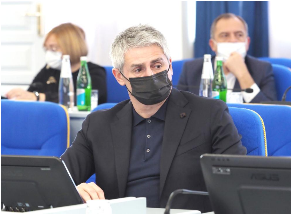
И.В. Лавров на заседании комитета

О ежемесячных планах работы комитета Думы Ставропольского края по образованию, культуре, науке, молодёжной политике, средствам массовой информации и физической культуре