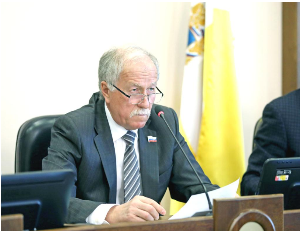
Председатель Думы Ставропольского края Н.Т. Великдань на заседании Думы Ставропольского края

Внесен Губернатором Ставропольского края В.В. Владимировым совместно с Правительством Ставропольского края.