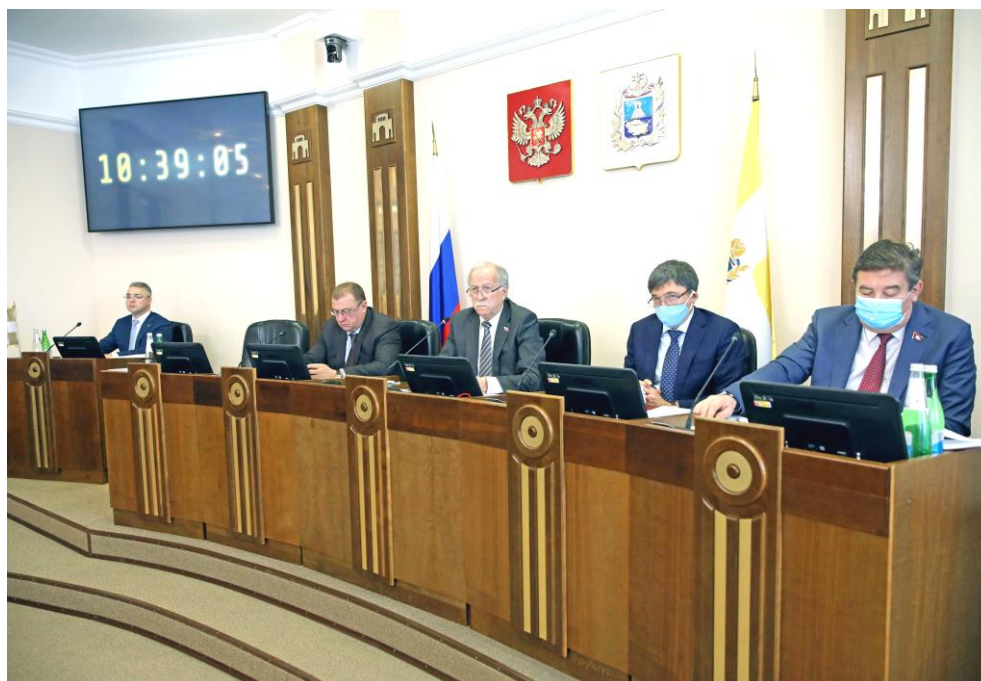
Заседание Думы Ставропольского края