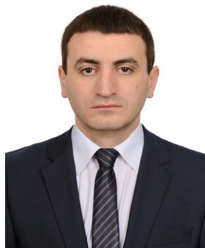
МЕЛИКОВ МИХАИЛ ИОСИФОВИЧ